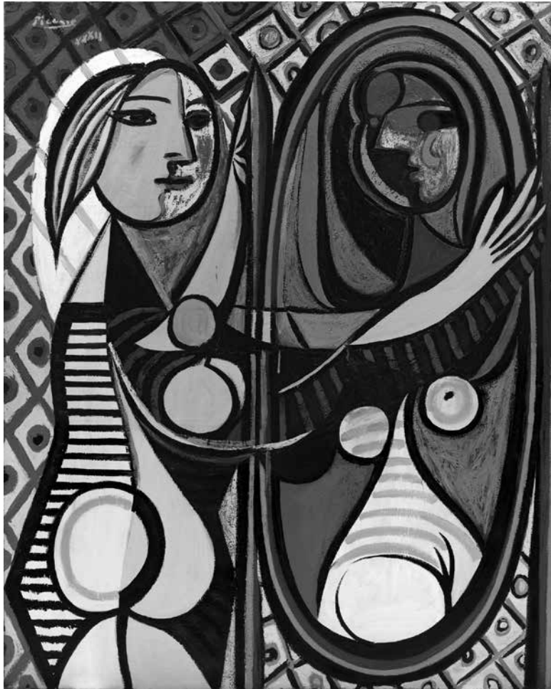
6. Pablo Picasso: Leány tükör előtt , 1932 Olaj, vászon, 162,3 cm × 130,2 cm. Museum of Modern Art, New York, ltsz. 2.1938

az ábrázolt alakot pedig – korábbról már ez is ismerős lehet –: „művész-papnak” ( chudožnik-žrec ) és „művész-királynak” nevezte. 68