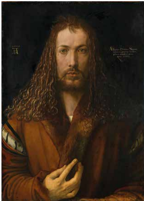
3. Albrecht Dürer: Önarckép , 1500 Olaj, fatábla, 67,1 × 48,9 cm Alte Pinakothek, München, ltsz. 537

bemutató részben már felvázolt – speciális referencialót reprezentálja az 1935–1936-os: az ikonokat központi problémaként kezelő, körülbelül fél-háromnegyed évnvi periódus logikája szerint a Felmutató .