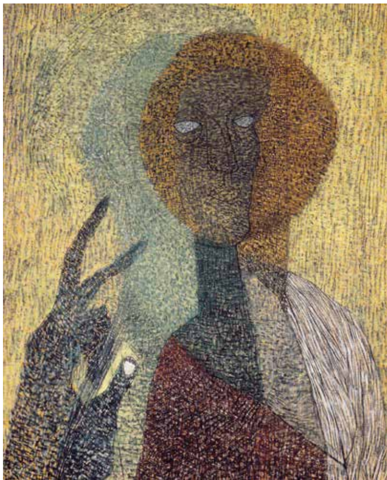
1. Vajda Lajos: Felmutató ikonos önarckép , 1936 Pasztell, papír, 900 × 620 mm Kovács Gábor Művészeti Alapítvány

Vajda az 1936. augusztus 11-ei levélben azzal indokolta a népművészethez mint egyetlen használható „tradícióhoz” való fordulást, hogy „a többi, ami ezen kívül áll, az a legnagyobbbrészt értéktelen szemétkerakat [...]”. 4 Vajda radikálisan elutasító és lesújtó véleménye a múlt és főképp a jelen magyar művészetéről, a kapcsolódás és folytatás lehetetlenségéről nem volt véletlen és főképp nem volt előzmények nélküli.