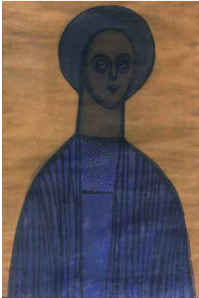
2. Vajda Lajos: Ikonos önarckép , 1936 Pasztell, papír, 900 × 600 mm Ferenczy Múzeumi Centrum, Szentendre, ltsz. 83.35

kell lennie, és az is lesz.” 6 Érdekes ebből, a kiállítás(ok) problémájából kiindulni.