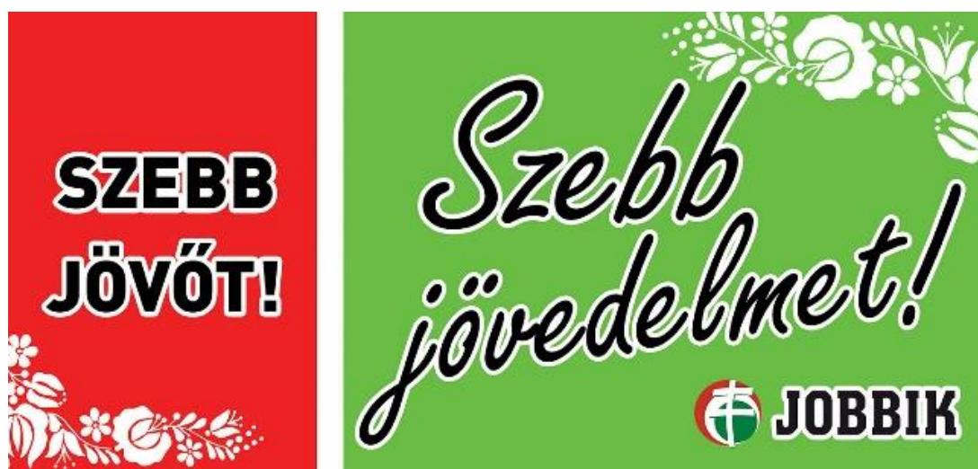
4. kép. A Jobbik plakátja 2014-ből.

A szegregáció eljárása a 2014-es kampányban jelenik meg. A 4. képen látható fehér sáv azt jelzi, hogy a plakát két része között van eltérés, ugyanakkor találni vizuális rímeket is. A piros mezőben olvasható „szebb jövőt!” a nemzeti radikálisok metaforája, míg a zöld sávban látható felirat a kínált jövőt jelöli. A zöld rész nagyobb, tehát a jelkészítő a nézők figyelmét erre kívánja orientálni. A képi kommunikáció materiális és konkrét ígérete: a Jobbik hatalomra kerülésével több jövedelem jut mindenkinek. A magyar trikolor és a magyar népviseletből ismert kalocsai hímzsminta használata a párt nemzeti-népi elköteleződését erősíti.