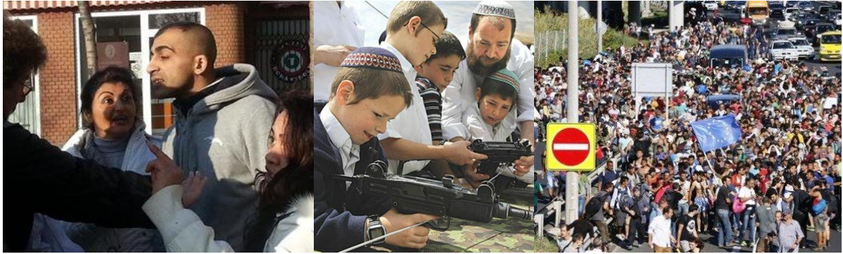
9. képsorozat. Válogatás a kuruc.info képei közül: cigányok, zsidók, migránsok

A nemzeti radikálisok körében gyűlöletes csoportok vizuálisan is megjelennek. A cigányok erőszakossága, a zsidók hódítása és a bevándorlók özöne ismétlődik a közösség képi világában. Az outgroup nemcsak fenyegető, hanem a jelenléte tömeges. Az ingroup tagjai kevesen vannak, az ellenségek viszont rengetegen.