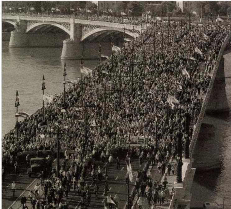
Magyar Nemzet, 2013. április 11.

idején sikerül összehívni soktízezer résztvevőt, pedig – ahogy említettem – Orbán Viktor nem is jelenik meg.