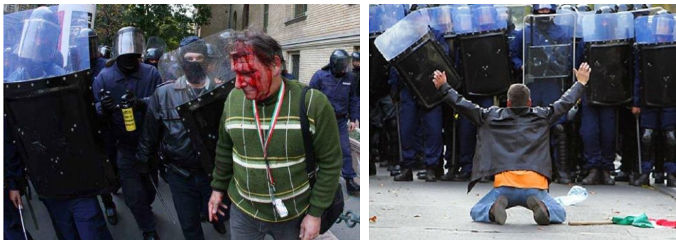
6. képsorozat. Képek a 2006-os kormányellenes tüntetésekről.

A nemzeti radikális közösség önképét nagyban meghatározza a 2006-os és 2007-es kormányellenes tüntetések vizuális emlékezete. A fizikai bántalmazás, a vérző testek képei a közösség szenvedését és áldozatát kívánják megmutatni. A térdre ereszkedő testtartás a megadást és a magasabb rendű krisztusi alázatot jeleníti meg. A képi konstrukción a tüntetők fegyvertelennek, engedelmesnek és békésnek látszanak, arcukon a fájdalom jelei.