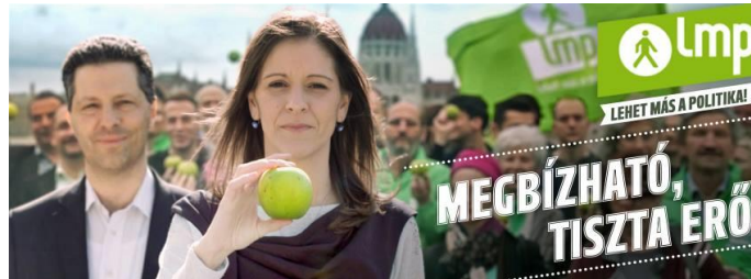
10. kép: LMP Facebook, 2014. március 27. 215

A 2014-es kampány meghatározó eleme a zöldalma, amit az utcai standoknál osztanak az embereknek, de önmagán túlmutató szimbólumnak is tekinthető. 216 Mint gyümölcs utal a természetre, továbbá megtestesíti a párt ökológiai voltát, és a színe egyezik a párt által választottal. Az egészséges zöldalma a párt jelképévé válik, a kampányvideóban 217 minden szakpolitikai elképzeléshez egy-egy zöldalmába harapó szereplő kapcsolódik. Ezzel metaforizálják a megbízható és tiszta erőt, ami összeköti a választókat, függetlenül attól, hogy városiak vagy vidékiek, irodában vagy a földeken dolgoznak, fiatalok vagy idősek. Az alma pártjelképpé válása visszautalhat a Fidesz korábbi narancsszimbólumára, tehát egy gyümölcs szemiotikai erőforrássá válása visszatérő elemnek tekinthető a magyar politikai kommunikációban.