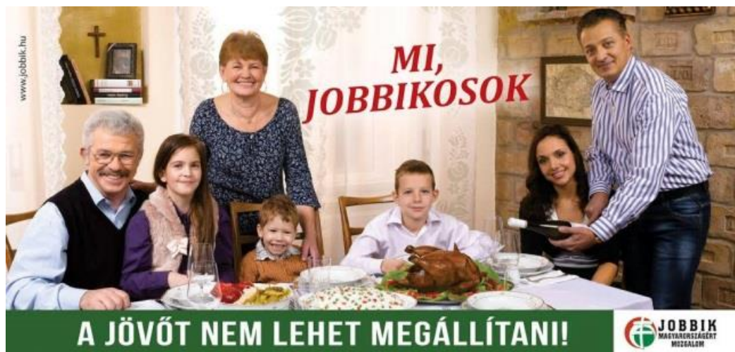
2. kép A Jobbik plakátja 2014-ből.

A 2014-es kiadványban a Jobbikot támogatók reprezentálása történik. A képen látható a párt által preferált hagyományos, többgenerációs, többgyermekes családmódel. A berendezés, az öltözetek és a gazdagon terített asztal alapján viszonylagos jómódban élnek. A család és a közös étkezés képeihez a magyar kultúrában többnyire kellemes élményeket szokás társítani, így a jelkésztő okkal remélhette, hogy ebben a kontextusban is működik a képzettársítás. A kompozíció a családi fényképekhez hasonló, magas modalitású. A tekintetek itt is a nézőre szegeződnek. Jól kivehető a kereszt és a Nagy-Magyarország térkép, ezek a nemzeti radikális értékek metaforái. A felirat alapján az integrációs és identifikációs szándék túlmutat a Jobbikra történő szavazáson, hiszen nemcsak felnőttek, hanem gyermekek is részét képezik a közösségnek.