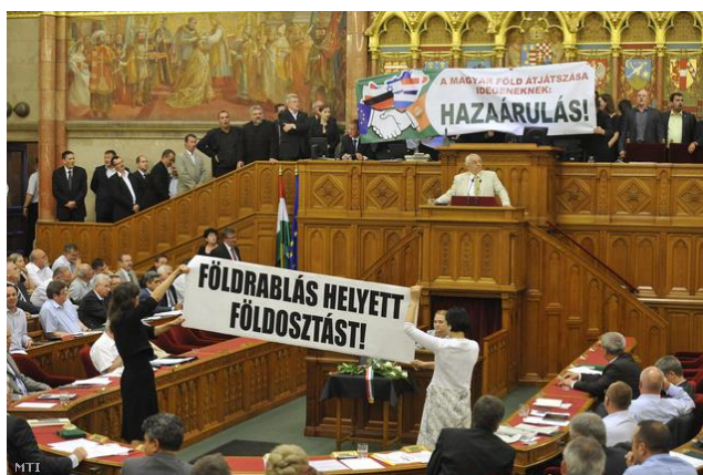
9. kép: Balhé a parlamentben, érvénytelennek mondják a földtörvény elfogadását. Index, 2013. június 21.

Az LMP egyik legismertebb parlamenti performansa a földprivatizáció elleni küzdelem ügyében történik; ekkor mind vizuális eszközöket, mind hanghatásokat bevetnek. Aranytalicskában visznek fekete földet Orbán Viktornak, „Földrablás helyett földosztást!” feliratú transzparenst helyeznek ki a patkó közepére, és hangosbeszélőben szólítják fel a Fideszt, hogy adja vissza a gazdáknak a földjeiket. Mindeközben a Jobbik képviselői „A magyar föld átjatszása idegeneknek: hazaárulás!” feliratú molinóval az elnöki emelvényre állnak fel és névszerinti szavazást kérnek. A szavazás végül érvénytelen lesz. 214