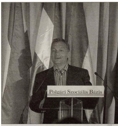
Magyar Nemzet, 2009. május 18.

A nemzeti-polgári centrum médiája sokat tesz azért, hogy reményt sugalljon a nehéz időkben, fakadjon ez a nehézség akár a baloldali kormányzás kártéteményeiből, akár az ország rendezetlenségének nem könnyű feladatából. Ennek a biztatásnak az egyik eszköze láthatólag Orbán Viktor mosolygós ábrázolása. Az ilyen képeken a pártelnök nem önfeledten kacag, mint ahogyan Gyurcsány Ferencet szeretik ábrázolni, hanem inkább magabiztosan nevet.