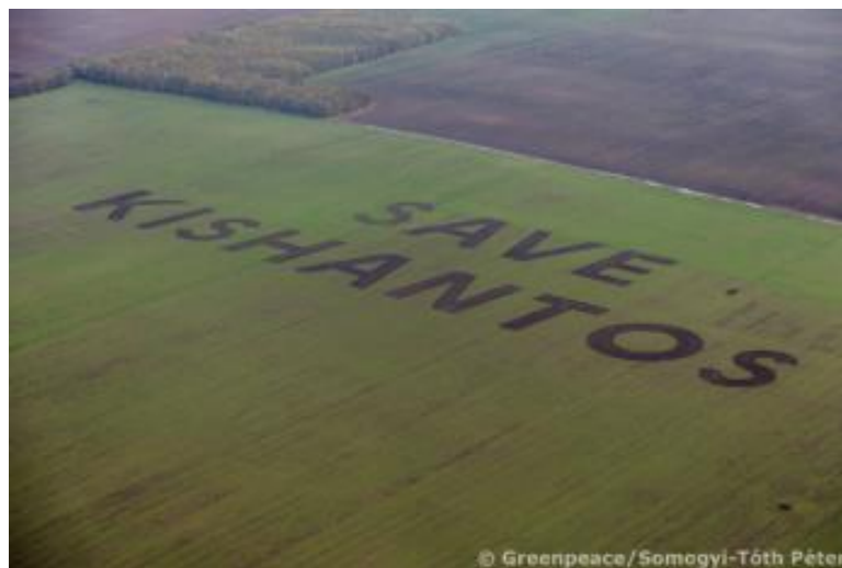
6. kép: (S)ave Kishantos! Greenpeace/Somogyi-Tóth Péter, greenfo.hu, 2013. október 19.

A szokatlan helyen elhelyezett írások két további példája látható a Clark Ádám téren és Kishantoston. A figyelemfelkeltés eszközeként olyan helyeken ábrázolta mondandóját a Greenpeace, ahol nem számítana rá senki, és pont ezzel válik érdekessé az üzenet.