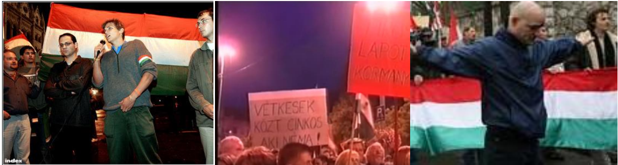
5. képsorozat. Képek a Kossuth térről.

A 2006-os Kossuth téri tüntetők látványvilágát a magyaros motívumok (magyar és Árpád sávos zászlók), a saját gyártású transzparenszek, illetve a tüntetőkről készült képek határozzák meg.