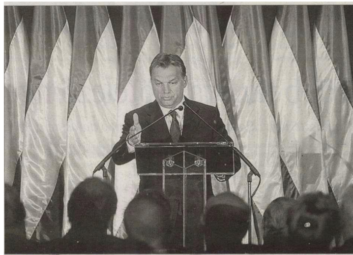
A képfelirat: Vége az emberek feje feletti kormányzás politikájának

A Magyar Nemzet néha ironikusan is ábrázolja a miniszterelnököt. Az alábbi a napilap 2010. szeptember 8-i számának a címlapi képe.