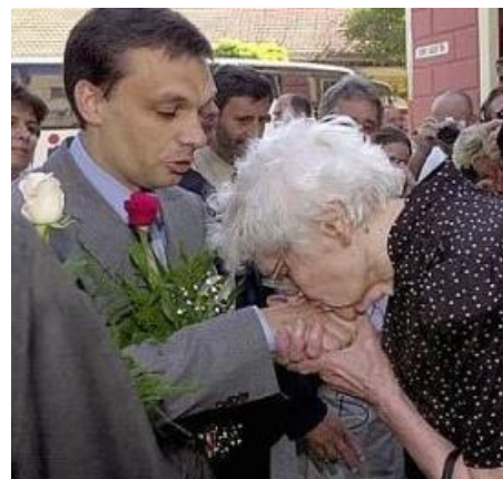
8. képsorozat Orbán Viktorról.