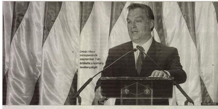
Magyar Nemzet, 2010. szeptember 13.

A Magyar Nemzet néha ironikusan is ábrázolja a miniszterelnököt. Az alábbi a napilap 2010. szeptember 8-i számának a címlapi képe.