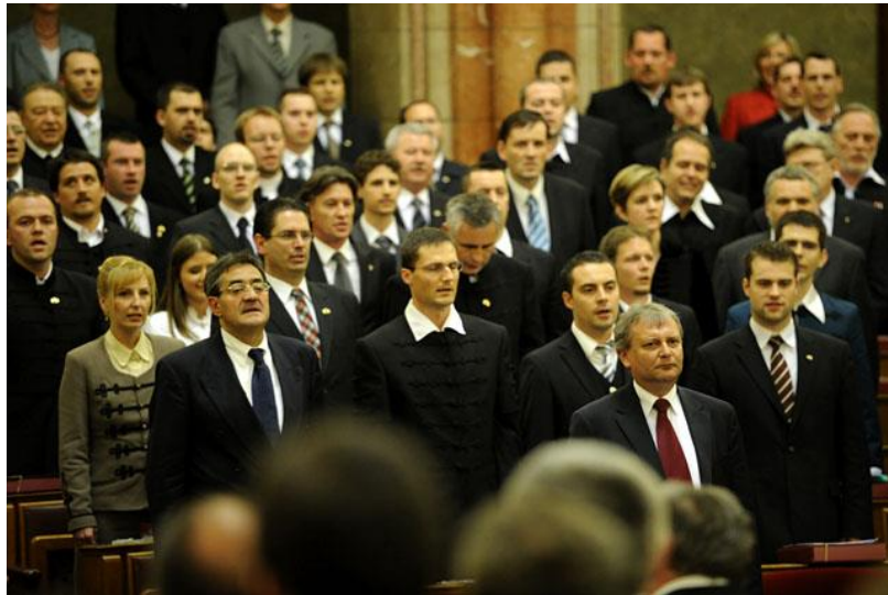
5. kép A Jobbik frakció tagjai 2010. május 14.

A nemzeti radikálisok adnak a külsőségekre. A közösséget identifikáló öltözékek a magyaros viselet, férfiaknál a bocskai vagy az atilla kabátok modernizált változata. Viselője a magyar nemzeti hagyományok iránti tiszteletét, nemzeti és keresztény irányultságát fejezi ki. Kötődik a miépes politikai örökséghez is, hiszen a MIÉP frakció tagjai is rendszeresen bocskai és atilla kabátokban jelentek meg a parlamentben.