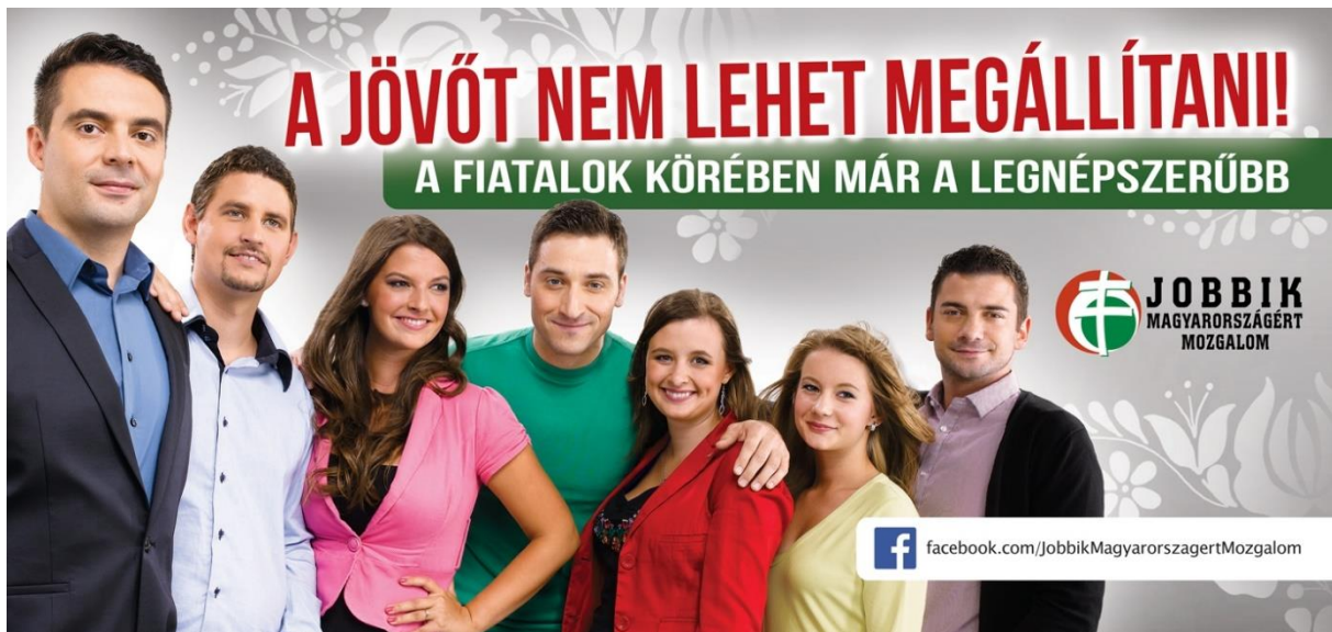
6. kép. A Jobbik plakátja 2013-ból.

A 2014-es plakátokon szereplőktől teljesen eltérő outfitet kínál a Magyar Harcos ruhamárka. Sötét alapszínen, piros-fehér-zöld minták, gót betűk, ősmagyar (turul) vagy katonai (tank, gépfegyver, ököl) motívumok stilizált ábrázolása jellemzik a felsőruházatot.