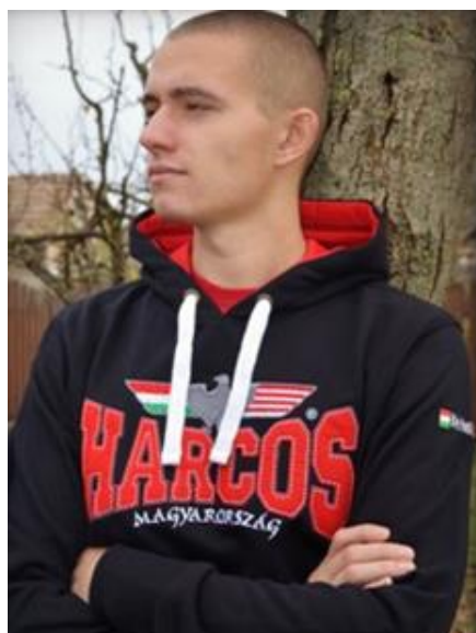
7. kép Magyar Harcos pulóvert viselő fiatalember.

A 2014-es plakátokon szereplőktől teljesen eltérő outfitet kínál a Magyar Harcos ruhamárka. Sötét alapszínen, piros-fehér-zöld minták, gót betűk, ősmagyar (turul) vagy katonai (tank, gépfegyver, ököl) motívumok stilizált ábrázolása jellemzik a felsőruházatot.