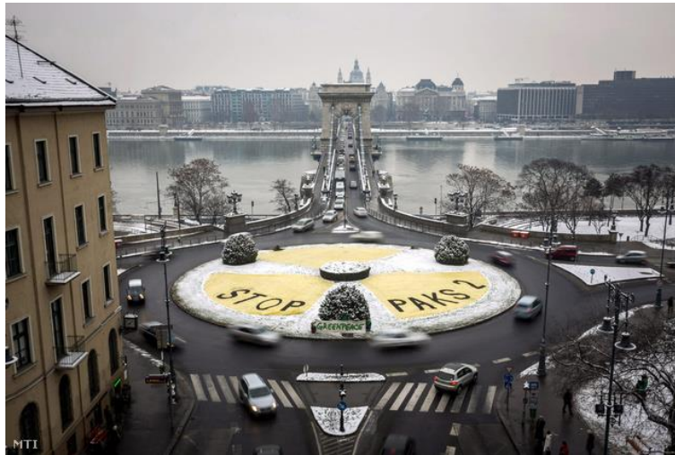
5. kép: A Greenpeace nemet mond Paksra. Index, 2014. január 30.

A fenti képen látható akció keretében a szemmagasságnál feljebb, a híd tetejére elhelyezett molinó messziről is vonzza a tekintetet, a méretével pedig azt az érzetet kelti a nézőben, hogy valami nagy, fontos dologról van szó. Ezt erősíti fel az is, hogy az aktivisták feltűnő, a molinóval egyező színű ruhákat hordanak.