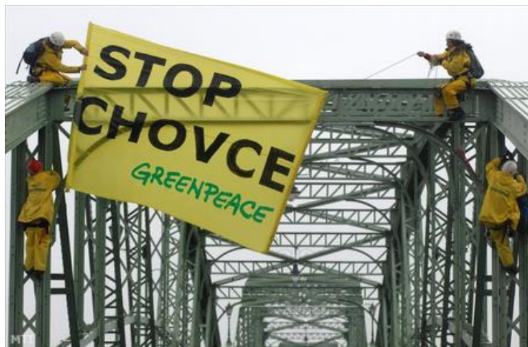
4. kép: Az esztergomi hídon demonstrált a Greenpeace. Index, 2009. október 12.

Ahogy az fentiekből is látható, a demonstrációk, láncok és molinók az egész zöld közösségre jellemző eszközök, de a leginkább látványos akciók a Greenpeace-hez köthetők. A szervezet a sárga és zöld színekkel megteremti a feltűnő látványvilágot, de eszközeik túlnyúlnak a színhasználaton. Nagyméretű feliratokat készítenek, amiket lehetetlen nem észrevenni, továbbá ezeket szokatlan magasságokban helyezik el.