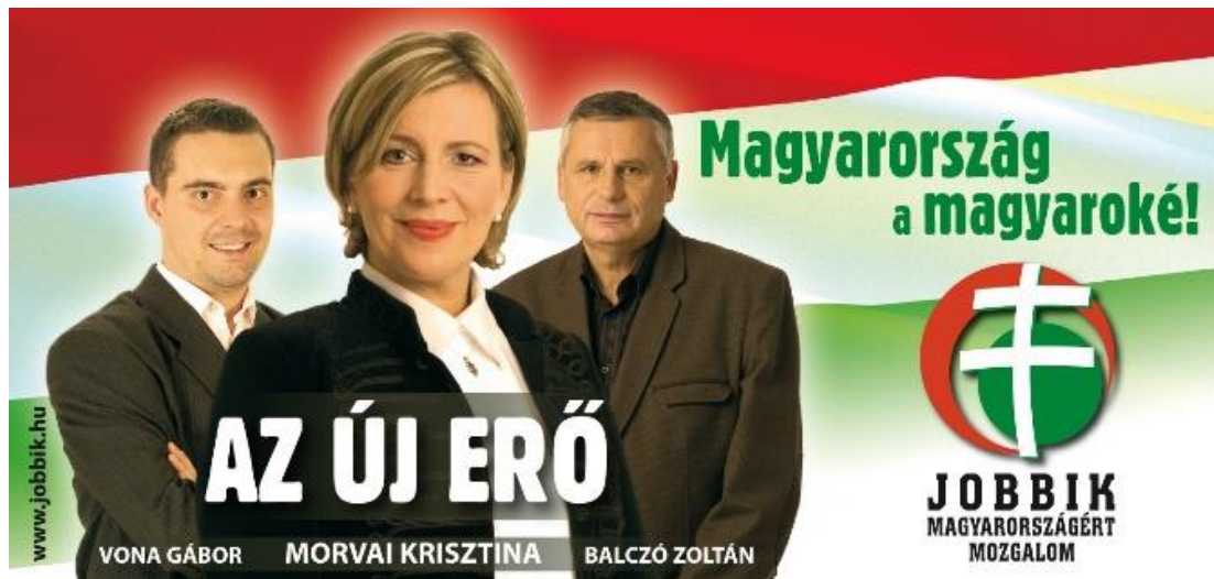
1. kép. A Jobbik plakátjai 2009-ből.

A Jobbik logója az előző korszakhoz képest nem változott, ennek leírása olvasható a Nemzeti radikálisok, 1997-2006 című tanulmányban (Szabó, 2017: 444). A Jobbik plakátjait azonban érdemes közelebbről szemügyre venni. A reprezentáció tekintetében jól látható az eltérés az alábbi 2009-es és 2014-es plakát között. Az előbbin a párt vezető politikusai láthatóak. A kép központi alakja Morvai Krisztina, képviselőjelölt, köztársasági elnök-jelölt, mögötte Vona Gábor pártvezető és Balczó Zoltán képviselő-jelölt. A kompozíció főszereplője nő, akinek szemünkbe fúródó tekintete egyértelműen a kapcsolatfelvétel szándékának a jele: a jelkészítő figyelmet és támogatást kér a nézőtől. A főszereplő közelebb áll, mint a két férfi; itt is világos a szándék: koncentráldják Morvai Krisztinára a figyelem. A montázsban a párt logója, a választási jelszavak, a magyar zászló és a személyek egymásba érnek, a tekintetek vektora a nézőt is integrálja. Mindez a közösség egységét hivatott jelezni: a párt, a politikusok, a pártprogram és a plakátot megtekintő állampolgár közötti szoros kapcsolatot.