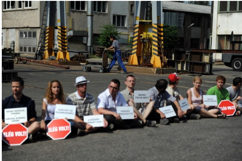
3. kép: A Közgép telephelyéhez láncolták magukat az elempések. Index, 2012. július 11.

Ahogy az fentiekből is látható, a demonstrációk, láncok és molinók az egész zöld közösségre jellemző eszközök, de a leginkább látványos akciók a Greenpeace-hez köthetők. A szervezet a sárga és zöld színekkel megteremti a feltűnő látványvilágot, de eszközeik túlnyúlnak a színhasználaton. Nagyméretű feliratokat készítenek, amiket lehetetlen nem észrevenni, továbbá ezeket szokatlan magasságokban helyezik el.