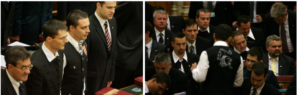
1. képsorozat. Vona Gábor a magyar országgyűlésben. 2010. május 15.

Vona Gábor vizuális konstrukciójában is látható egy ív. A korai éveket a militáns stílus és a közösséghez tartozás jeleit erősen hangsúlyozó képi megjelenítés dominálja. Később a jelkésztők a pártvezető egyéniségét, egyediségét hangsúlyozzák. Mindemellett lágyítják is Vona Gábor imázsát, a harciasságot az érzékenység és a határozottság dinamikus váltakozása váltja fel. A pártvezető közösségi média platformja számos képet közöl gyerekekkel, barátokkal, kisállatokkal, de többször láthatjuk a közösség elhivatott vezetőjeként, aki beszédet tart, irányt mutat, célokat jelöl ki.