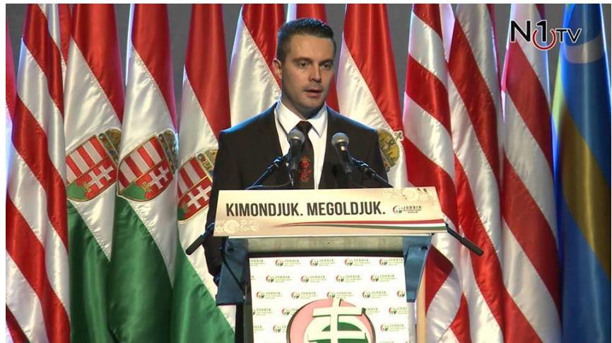
2. képsorozat. Vona Gábor 2015. október 15. 207 ; Vona Gábor 2015. január 31.