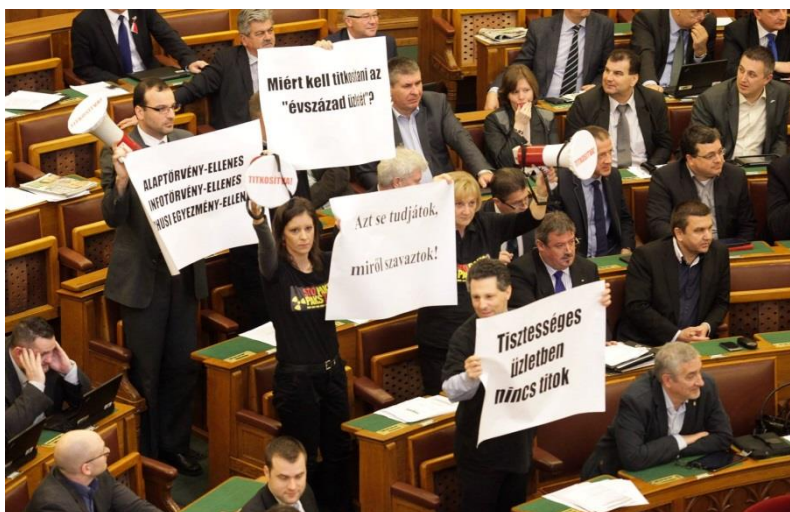
8. kép: LMP Facebook, 2015. március 03. 213

Az LMP egyik legismertebb parlamenti performansa a földprivatizáció elleni küzdelem ügyében történik; ekkor mind vizuális eszközöket, mind hanghatásokat bevetnek. Aranytalicskában visznek fekete földet Orbán Viktornak, „Földrablás helyett földosztást!” feliratú transzparenst helyeznek ki a patkó közepére, és hangosbeszélőben szólítják fel a Fideszt, hogy adja vissza a gazdáknak a földjeiket. Mindeközben a Jobbik képviselői „A magyar föld átjatszása idegeneknek: hazaárulás!” feliratú molinóval az elnöki emelvényre állnak fel és névszerinti szavazást kérnek. A szavazás végül érvénytelen lesz. 214