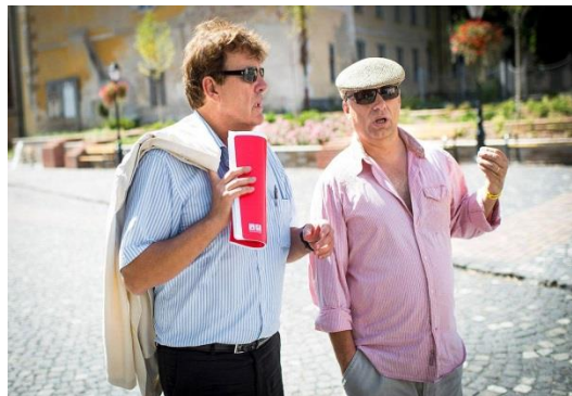
1. ábra: Orbán Viktor gyakran használt vizuális megjelenítései