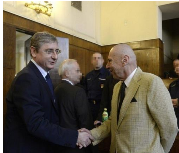
7. képsorozat Gyurcsány Ferencről.

Az Orbán Viktorról közölt képek között a korszakban visszatér az első Orbán-kormány idején készült fotó, melyen egy idős hölgy kezét csókol neki. Ezzel erősítik meg azokat a diszkurzív elemeket, amik Orbán Viktort arrogánsnak, a nép fölé emelkedő, azokat lenéző politikusnak mutatják.