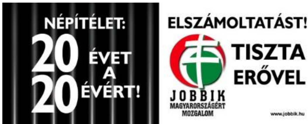
3. kép. A Jobbik plakátja 2010-ből.