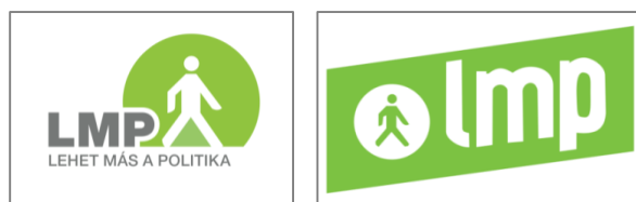
1. kép: Az LMP logói 209

A sétáló, haladó ember piktogramja olyan tájékoztató ábra, amit feliratok helyett alkalmaznak, és önmagában egy egész fogalmat jelöl: közlekedési táblákon és jelzőlámpákon a gyalogos átkelőhelyet, illetve a szabad átkelést mutatja. A képalkotó célja tehát az egyszerű megjegyezhetőség és a tartalmi kapcsolat kialakítása: az LMP az átkeléssel és a haladással asszociálódik.