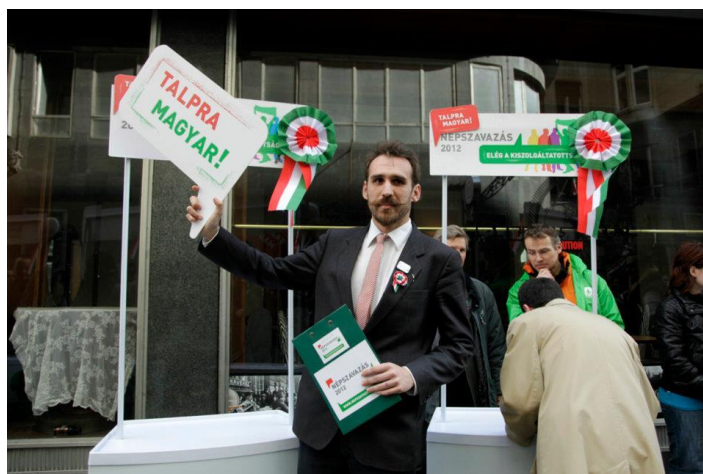
12. kép: LMP Facebook, 2012. március 15. 221

A közösség látványvilágához tartozik Vágó Gábor bajsza, ami a március 15-ei eseményeken kokárdával és Petőfi idézettel a márciusi ifjakra utalva 219 egyfajta Petőfi-konstrukciót épít. A bajusz végül olyan szemiotikai erőforrássá válik, amire más közösségben is utalnak. 220