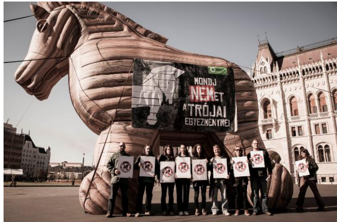
7. kép: Trójai egyezmények: egyre aggasztóbb a kép. mtvsz.blog.hu, 2015. január 08.

Az MTVSZ trójai falova szintén a meghökkentő méretével kelti fel a figyelmet, és azzal, hogy olyan környezetben állították fel, ahol nem számít rá senki. Ebben az esetben is megfigyelhetők a molinók, táblák, amik a szimbolikus üzenet mellé csatolják a konkrét mondandót. Továbbá a trójai faló metaforává is válik a közösségben, és a szókészletben az átláthatatlan kockázatokkal járó szerződéseket jelölik vele.