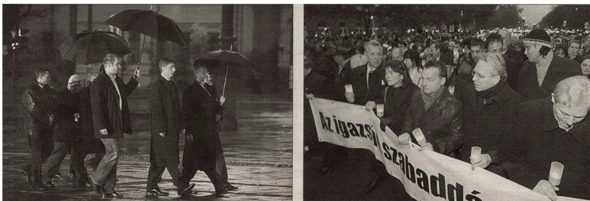
Magyar Nemzet, 2006. november 6.

2006. november 4-én Gyurcsány Ferenc egyedül koszorúz, Orbán Viktor viszont hatalmas tömeg élén gyalogol.