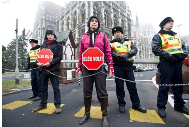
2. kép: A blokádra hivatkozva vitték be a rendőrök az ellenzéki képviselőket. Origo, 2011. december 23.

2011 végén a Parlament elé szervez demonstrációt az LMP. A párt parlamenti képviselői láncot kötnek a derekuk köré, és ennek a segítségével kötik magukat a Parlament északi és déli kapujához. Végül a rendőrség elviszi őket a kapuktól, a délutáni kiengedésüket követően tüntetést szerveznek. Ezen a demokrácia végéről beszélnek, ami az eseményről készült képeken látható vastag és feltűnő láncokkal, táblákkal nyeri el valós jelentését. Az eset a nemzetközi hírekbe is bekerül. 210