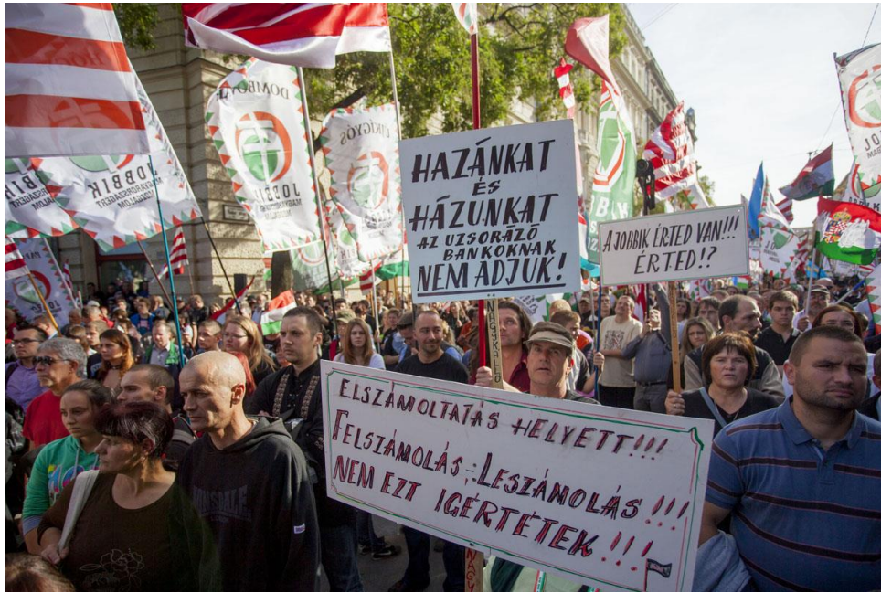
8. kép. Kormánykárosultak tüntetése. 2013. október 23.

A tüntetéseken jól látható, hogy a külsőségek, a ruha és a kiegészítők a politikai identitás megélésének integráns részei, a közösségi élmény megélésnek fontos eszközei. Sokan viselnek jobbikos pólót, jellemző a fekete vagy terepszínű viselet, a nemzeti rockzenét játszó együttesekre utaló, illetve Nagy-Magyarország térképet ábrázoló felsőruházat és ékszerek. Látni lehet néhány self-made megoldást is: trikolor szalaggal díszített baseball sapkát, Gyurcsány Ferencet becsmérő fotómontázsokkal teletűzdelt felsőt, Árpád sávok hajpántot. Különös összhangot biztosít a tömegnek az, hogy a megjelentek túlnyomó többsége fiatal férfi.