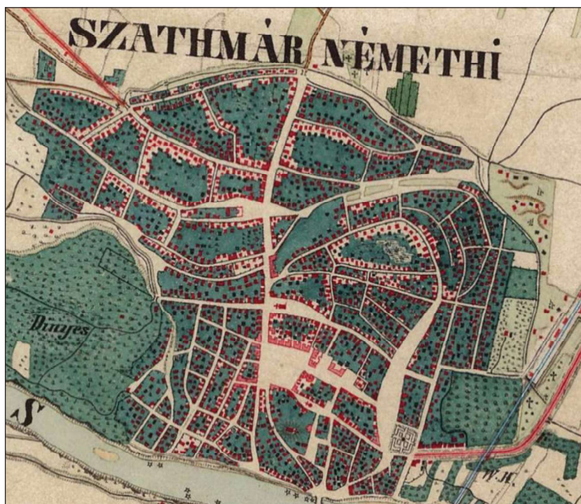
4. kép. Szatmárnémeti a második katonai felmérésen (vö. 21. jegyz.)