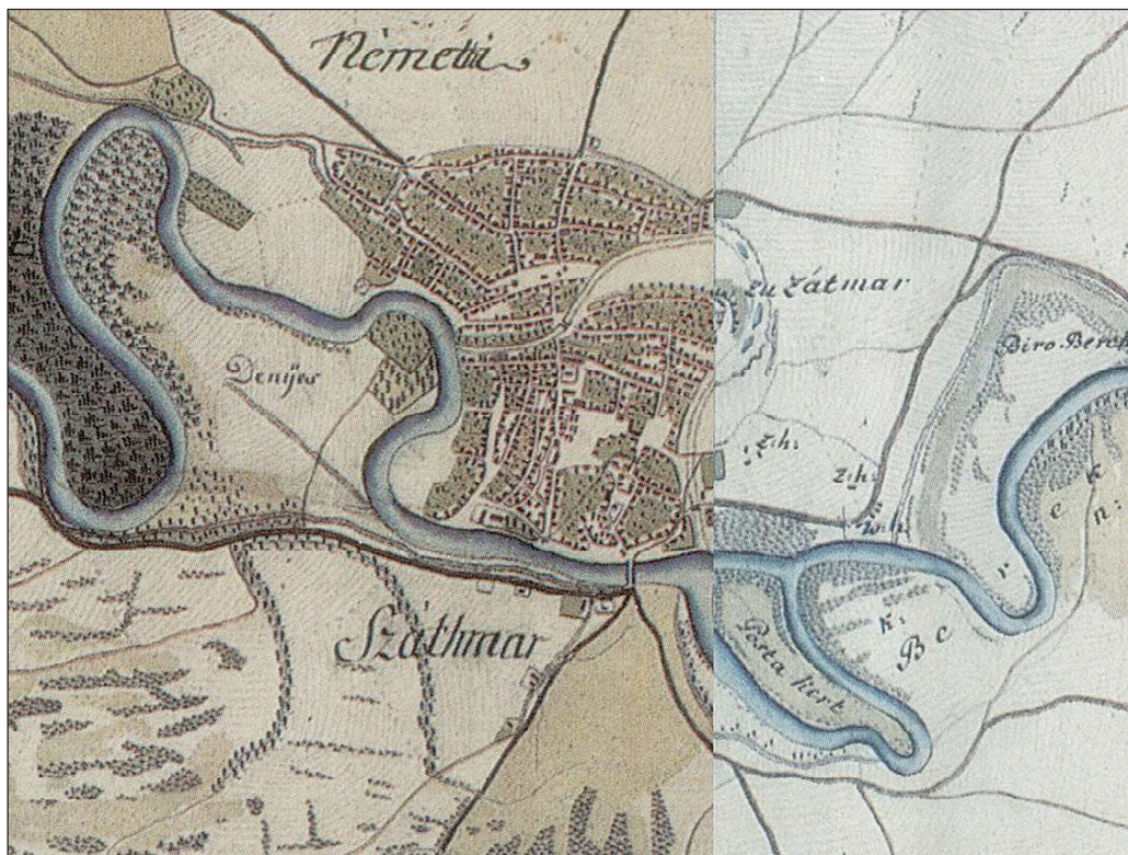
1. kép. Szatmárnémeti az első katonai felmérésen