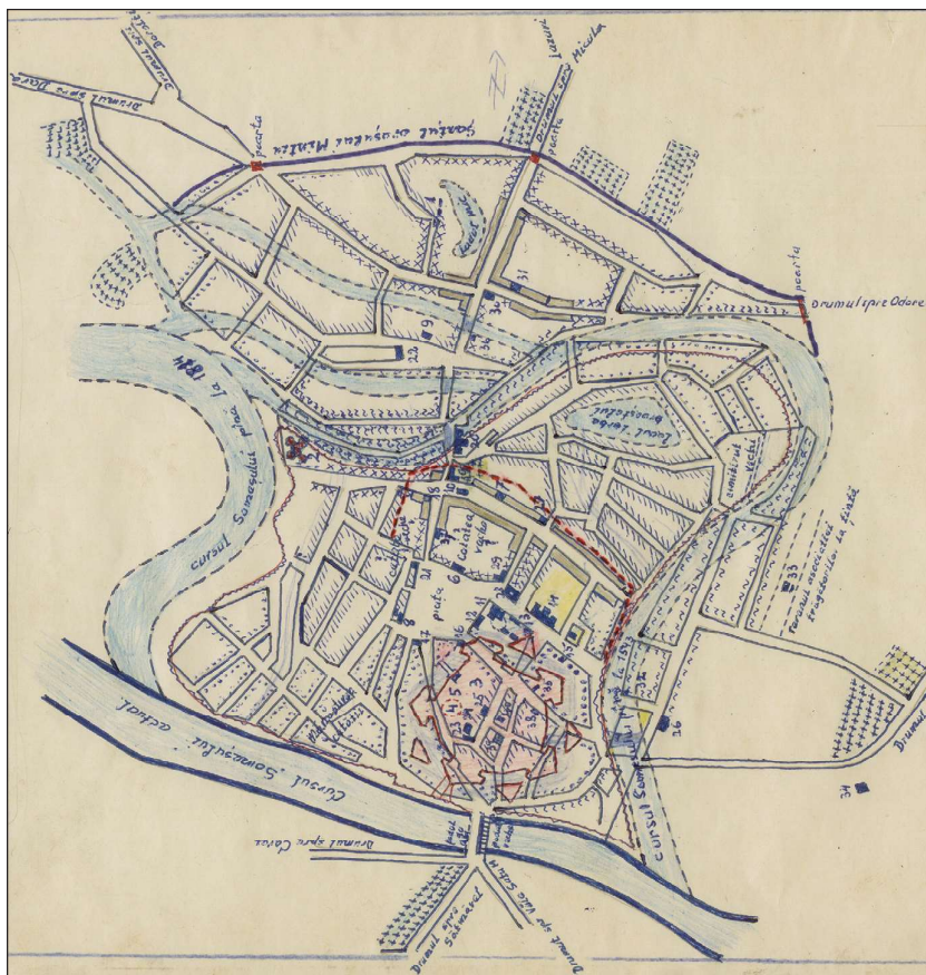
3. kép. Burai Béla vázlata Szatmárnémeti történeti topográfiájáról (Kézirat, Szatmár Megyei Múzeum)