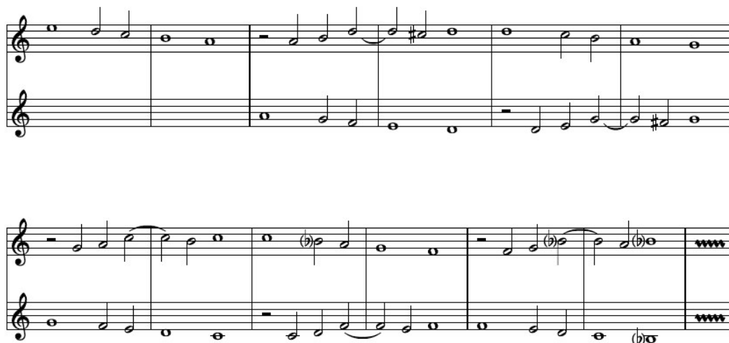
Thesselius, végtelen kánon

A kánonmotívum kétrészes, egy ereszkedő hangsorból és azt követő kadenciából tevődik össze.