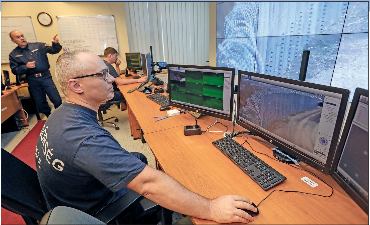
16. ábra. A határkerítést, a kommunikációs hálózaton keresztül, az irányító központból folyamatosan figyelik

lenléte mellett akár hazai szenzortechnológia kidolgozása is megvalósulhatna.