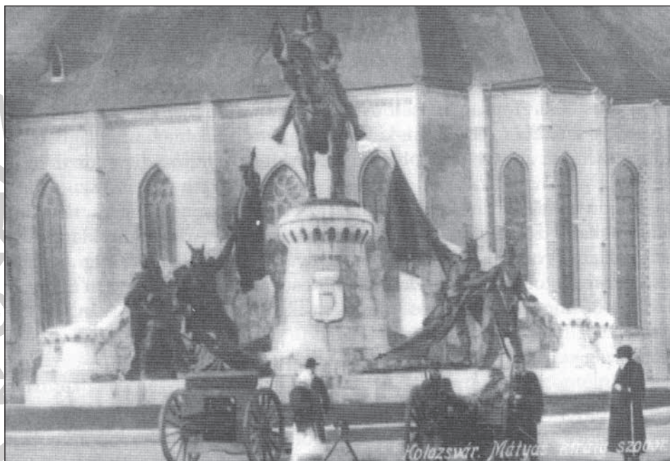
1. A Mátyás-szobor előtt közszemlére kitett hadiszákmány orosz és szerb ágyúk (1915. jan. 4.)