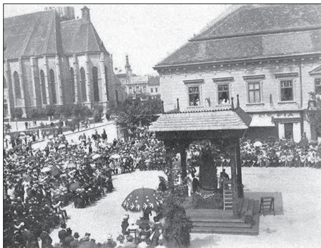
2. A Kárpátok Őre avatása (1915. aug. 18.)