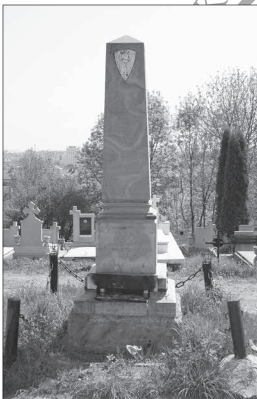
5. Első világháborús emlékmű a Kalandos temetőben (1943. jún. 27.)