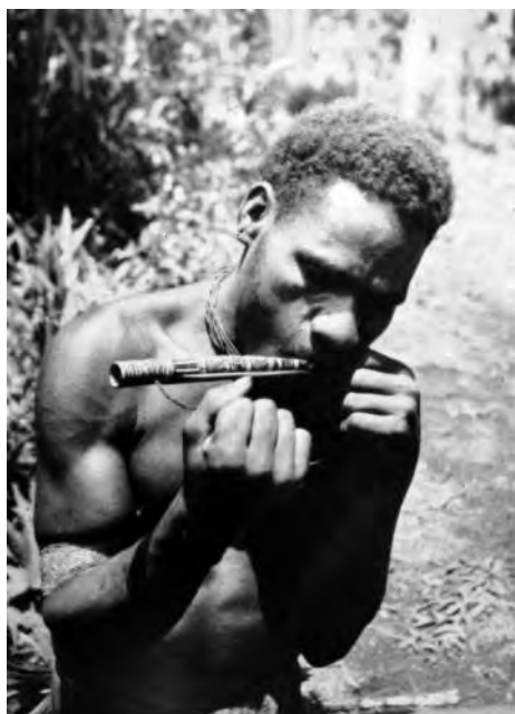
3. kép Pápua zenész idioglott dorombbal, Pápua Új-Guinea, Wahgi-völgy (Fotó: Jacques Villeminot, 1965.)

A morfológiai jellemzőkön alapuló komparatív kutatások alapján feltételezik, hogy a doromb Kína déli területein vagy Délnyugat-Ázsiában alakulhatott ki. 15 A csendes-óceáni szigeteken a hangszerek díszítésére alkalmazott növény és állati szimbolikus ornamentika vizsgálata alapján nem kizárt, hogy már a neolitikum idején megjelenhettek az első idioglott dorombtípusok. 16 (3. kép) Viszont régészeti leletekkel ezt mindezidáig nem tudták alátámasztani, mert az eddig ismert legkorábbi lelet az Altáj hegységből Chultukov Log 9 és Cheremshanka nevű régészeti lelőhelyek feltárásaiból előkerült ló vagy marha bordáiból készített, öt részben, vagy