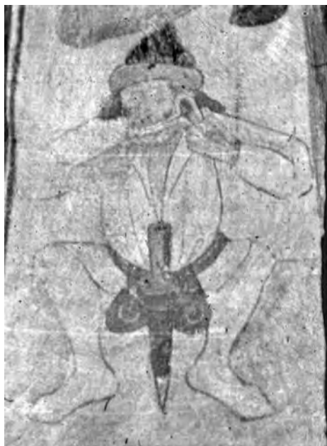
7. kép Dorombon játszó zenész (Albert piktor, Härkeberga templomának freskója, 1480 körül)