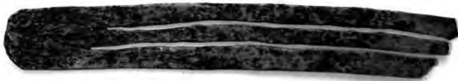
4. kép Idioglott doromb az Altaj-hegység vidékéről, Cheremshanka

egészben fennmaradt idioglott doromb, amelyek korát a hun-szarmata periódus időszakára datálják, és 1580–1740 évesre becsülik. 17 (4. kép)