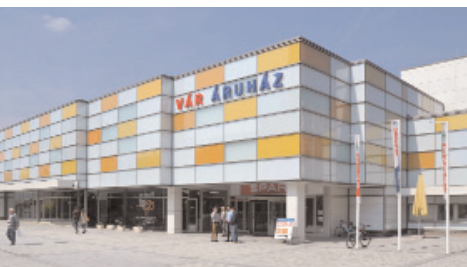
A tervezők az eredeti koncepcióban rejlő játékoságot bontották ki

A városfejlesztés súlyos tévedései és a kommunista bűnök nyomasztják még ma is Veszprém belvárosát. A szocialista városfejlesztésről részletes tanulmányosorozatot publikált Ware-Nagy Orsolya a Tervlap oldalain. [7] Az általa felvázolt történeti rekonstrukció alapján a Kossuth utca kereskedelmi szerepe az 1800-as évek ele-