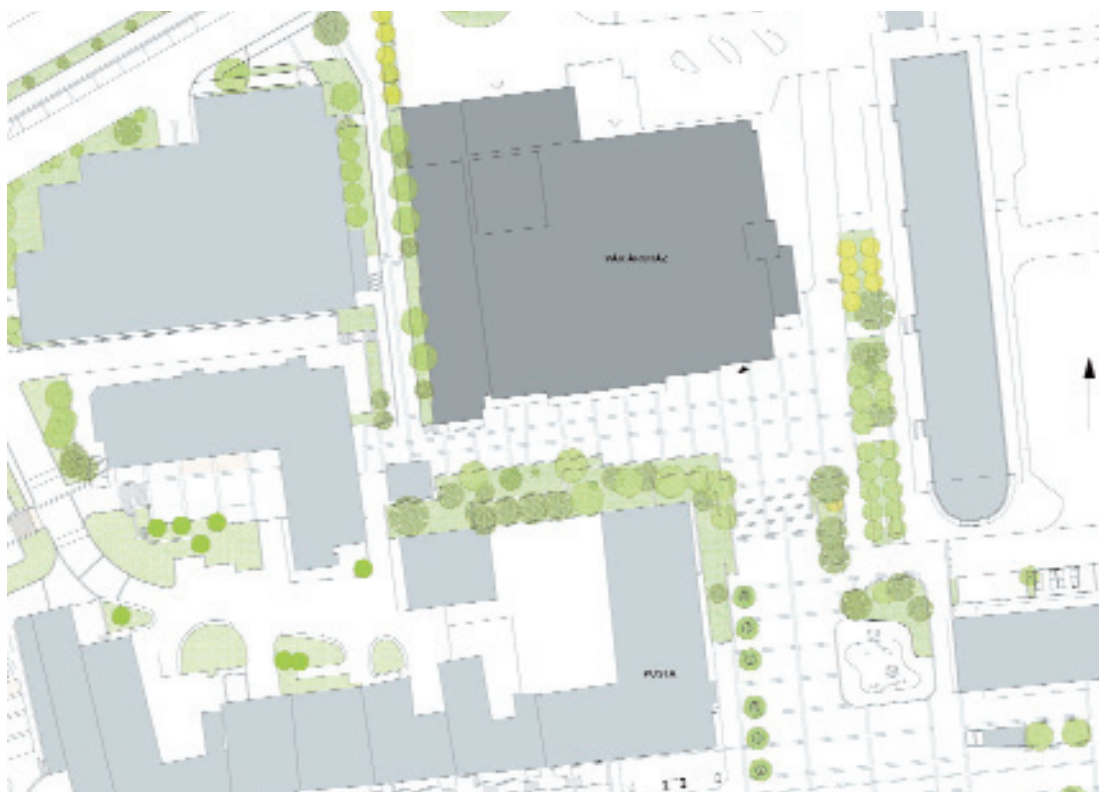
Helyszínrajz: modern szabadon álló beépítés az egykori Cserhát városrész helyén