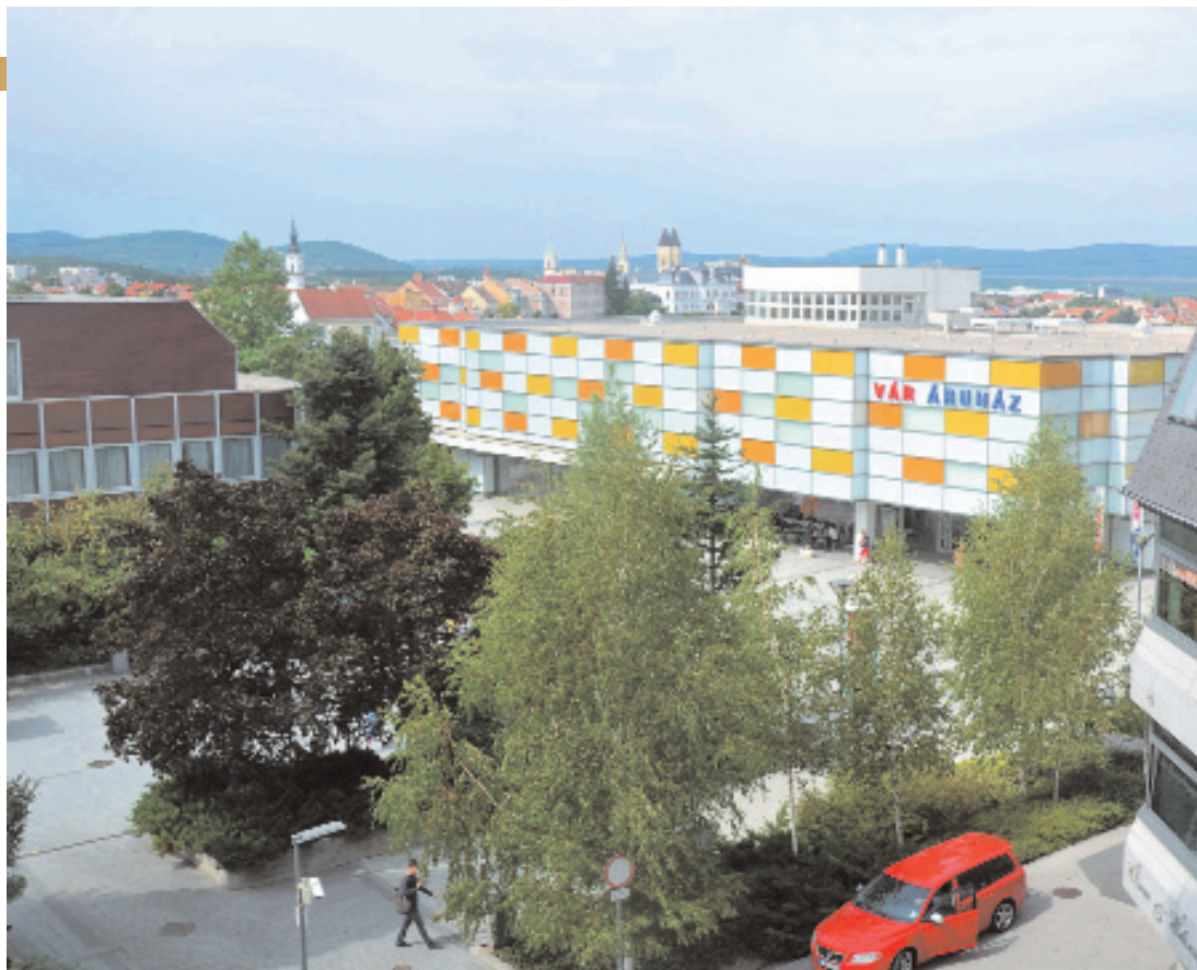
Veszprém poszt-socialista arculata

szerkesztett prospektusokban szemérmesen el lehet fedni a diktatúra hagyatékát, a városban sétálva már nem lehet megkerülni az őszinte szembenézést a kommunizmus örökségével. Az örökség szó is új értelmet nyer a tabula rasaként letarolt Cserhát városrész helyén felépített, az adott korban korszerű kereskedelmi központoknak állékonyosságát nézve. [5] A tizenkilenc szintes, de csak a veszprémi „húszemeletesként” becézett toronyház karakteresen átfurmálja a város középkori eredetű sziluttját. A legfelső szinten lakott Pap János hírhedt veszprémi párttitkár, aki az 1956-os forradalom utáni megtorlások egyik legkegyetlenebb ideológusa volt, nevéhez kötődik a Balaton kiszárítására és mezőgazdasági hasz-