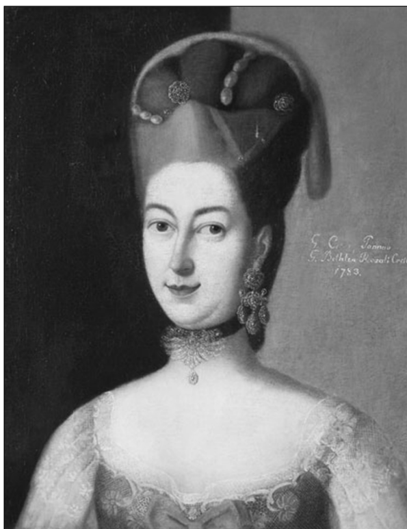
5. kép. Bethlen Rozália 1754–1826 (Csáky János, majd Wass Miklós felesége) 36

1792. október 20-án kelt adománylevele szerint három adósának tartozását juttatta a kolozsvári római katolikus convictusnak. 35 A négyezer forintos adományt kamatával együtt az alapítvány részének tekintette, ugyanakkor fenntartva családjá számára a jogot, hogy rokonságából, vagy a számukra fontos fiatal emberek közül ajánlhassanak a támogatott három nemesi ifjú közé.