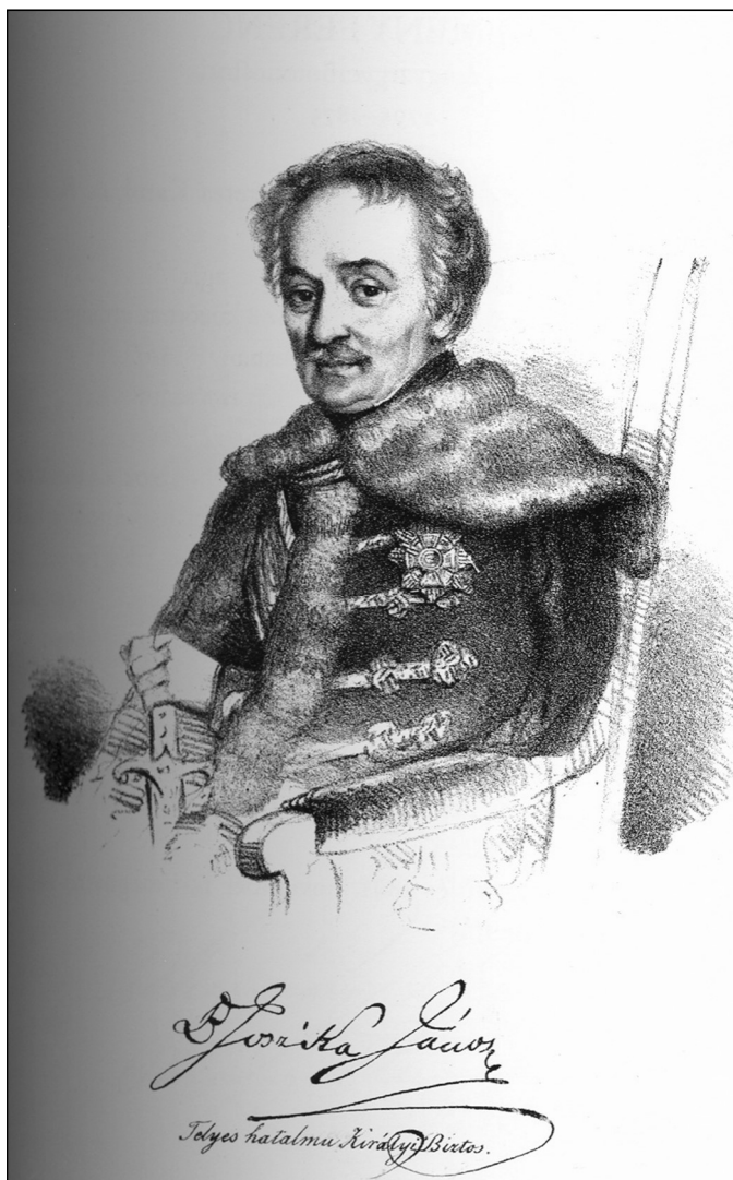
3. kép. Jósika János báró 1778–1843 28

kapott (a reformátusok közül és az evangélikusok közül is többen kaptak többet nála), őt tehát a nagypolitika játszómája tette gubernátorrá. 27 Bár Jósika Samu éppen Bécsben komoly karriert futott be, azt az ő 1843-ban meghalt apja már nem érthette meg. Komolyan szívére vette a kedvezőtlen fordulatot, amelynek feldolgozásában minden korábnál nagyobb szüksége volt felesége támogatására.