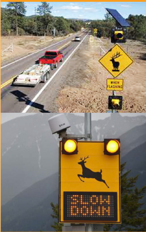
5. ábra: Út mellé telepített érzékelő rendszer [19, 20]

E rendszerek alkalmazásával kiküszöbölhetők a védőkerítések által előidézett problémák, mint elszigetelődés, belterjesség és a kerítésstressz. További előnye, hogy kvázi interaktív, ezért a standard veszélyt jelző táblákkal ellentétben nem áll fenn az úthasználók általi megszokás esélye.