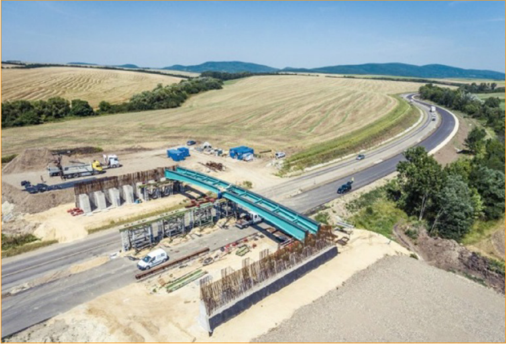
6. ábra: A 21. sz. úton épülő vadátjáró műtárgy [21]

is szerepet játszott, főleg hogy egy vad felüljáró szélessége duplája, akár háromszorosa egy két sávos közúti híd szélességének.