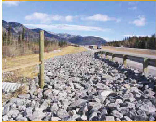
4. ábra: Sziklamező a Trans-Canada autópályán (USDOT 2009, p. 151)

tuk a Kanadában, az USA-ban, Brazíliában, a skandináv országokban, Szaúd-Arábiában és Ausztráliában használatos megelőző intézkedéseket. A külföldön bevált gyakorlatok közül kettőt mutatunk be, amelyek hazai rendszerbe történő adaptálásával több problémát is orvosolhatnánk.