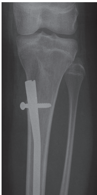
2. ábra Az implantátumok bevezetése a tuberositas tibiae-től kissé medialra és distalra történt.