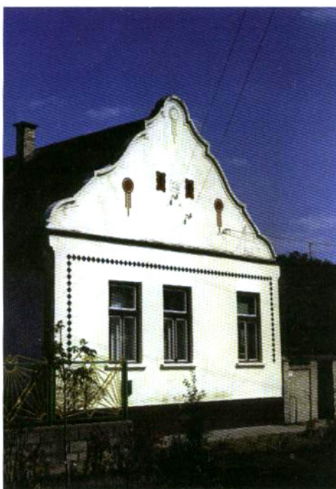
Hajósi házoromzat