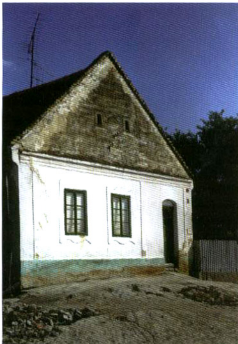
A máig fennmaradt egyetlen hegyre épített ház Hajóson

készült: Print 2000 Nyomda Kft. Kecskemét