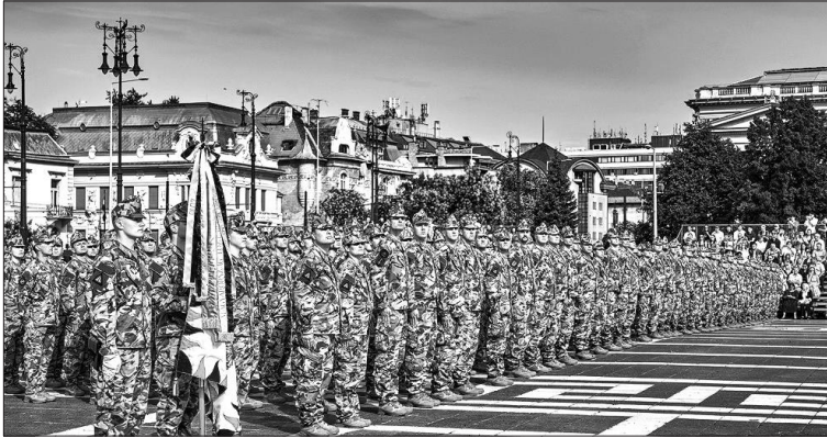
I. kép. Altisztek avatása 2018-ban

A jelenlegi rendszer 2015 óta működik és ennek keretében valósult meg 2019-ig egy átlagosan 50 százalékos illetményfejlesztés a katonák számára. A 2020 utáni évekre azonban már egy új, az időközben megváltozott feltételeknek megfelelő illetményrendszert kell megtervezni és működtetni, figyelembe véve azt is, hogy az ország gazdasági teljesítőképessége az utóbbi években jelentősen fejlődik, a foglalkoztatottság nő, a munkaerő-kínálat viszont beszűkült. Úgy kell tehát megjelenni a honvédségnek a munkaerőpiacon, hogy versenyképes maradjon.