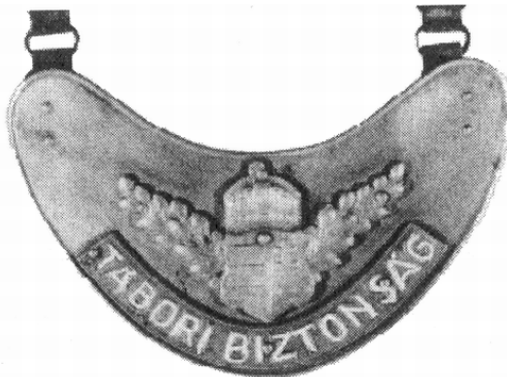
Táborig biztonsság jelvény

A német minta szerint előállított táborig csendőr jelvényt csupán néhány hónapig 1944 augusztusától 1944 novemberéig viselték. A nyilas hatalomátvétel után ugyanis létrehozták a táborig biztonssági szolgálatot, amely a táborig csendőrségből és a csapatcsendőrök helyett már korábban létrehozott harcfejelem biztosító és táborig rendészeti csapatokból, valamint az ide vezényeltékből állt. A táborig biztonssági szolgálat tagjait a már korábban a német minta szerint rendszeresített táborig csendőr jelvénnel látták el, de új felirattal.