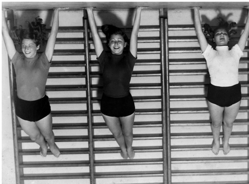
André Kertész: Hárman a bordásfalon (Szentpál-táncosnők), 1935.