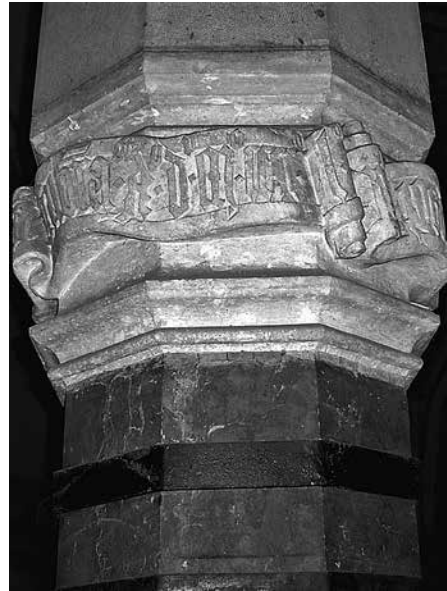
14. A vajdahunyadi (Hunedoara, Románia) vár földszinti nagytermének 1452-es évszámú, feliratszalagos oszlopfejezete a vörösmárvány oszloptörzs felső részével

Sírlapot keretező, hullámzó feliratszalagok a korábbi magyarországi síremlékanyagban nem ismertek. Figurák tartotta vagy a belső mezőben lebegő írásszalag természetesen akad, ha nem is túl nagy számban. A feliratszalagot tartó emberalakoknak óriási ikonográfiai hagyományuk volt a fal-, könyv- és táblaképfestészetben, de ilyesfajta emlékek a vajdahunyadi fejezeten körbefutó vagy a Szécsi Dénes síremlékét övező szalagok ötletadóinak aligha tarthatók. Az utóbbinál korábbi, hozzá közel álló megoldások elvéte említhetők Salzburg ma Felső-Ausztriába eső környezetében. A Hans Kuchler (†1436) Erblandmarschallt feleségével együtt ábrázoló, berakásokkal színezett tumbafedlap a Mattighofenben a férfi által alapított egykori Stiftskirchében, a mai plébániatemplomban mind a négy oldalon végigfutó írásszalagot hordoz, Friedrich Gunderstorfer kanonok (†1448) félprofilban ábrázolt alakja a Braunau am Inn közelében fekvő Ranshofen egykori prépostsági templomában pedig kezével megfogja a három oldalon húzódó (a láb alatt elhagyták) szalagot (15. kép) – a feliratot mindkettőn vésett betűkkel alakították ki. 67 Ezek, vagy hasonló darabok adhatták az ötletet a már a Salzach folyó bajor oldalán, Mattighofentől és Ranshofentől azonban csupán 20–30 km távolságban fekvő Burghausenben nagyjából 1475 és 1504 között működő Franz Sickingernek, de ő a motí-