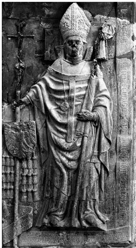
4. Szécsi Dénes esztergomi érsek (†1465) síremléke, Esztergom, a Bazilika altemploma