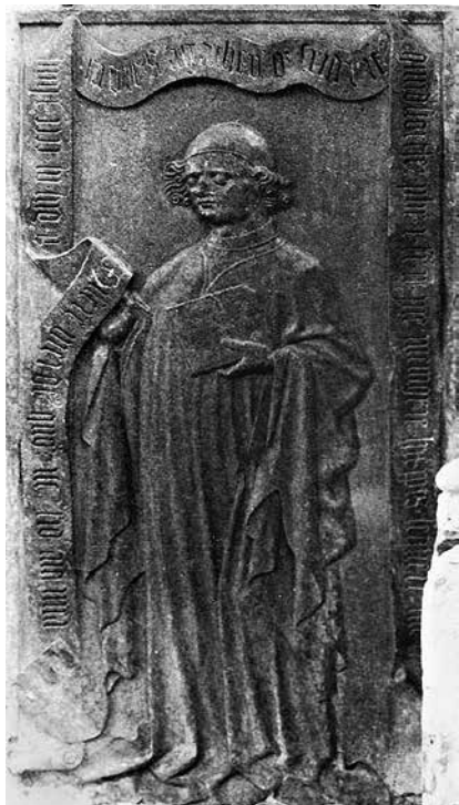
15. Friedrich Gunderstorfer kanonok (†1448) sírlapja Ranshofen egykori prépostsági templomában.