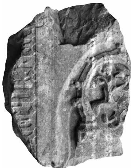
10. Főpap [Pálóci György esztergomi érsek (†1439)?] síremlékének töredéke Esztergom, Vármúzeum.