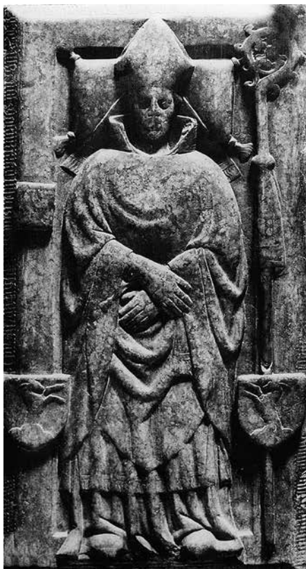
2. Berzevici György nyitrai püspök (†1437) sírlapja a nyitrai (Nitra, Szlovákia) székesegyházban

ben középkori és reneszánsz művészettel foglalkozó felolvasó ülésén, majd a pannonhalmi Paradisum plantavit kiállításához kapcsolódóan – pontosította, a csoportot újabb emlékekkel egészítve ki. 7 A kronológiai sor elején Berzevici György nyitrai püspök (†1437) nyitrai (Nitra, Szlovákia) sírlapja áll 8 (2. kép), őt követi József boszniai püspök (†1442/44) diakovári (Đakovo, Horvátország) sírkőtöredéke 9 (3. kép), majd a már említett Gatalóci-töredék, hogy végül Szécsi Dénes esztergomi érsek