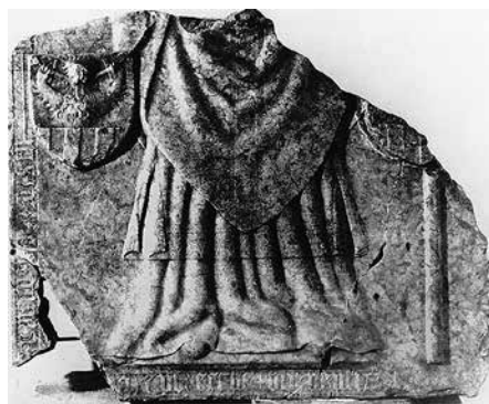
3. József boszniai püspök (†1442/44) diakovári (Đakovo, Horvátország) sírkőtöredéke, Zágráb, Hrvatski povijesni muzej HORVAT, Z. 1996 nyomán