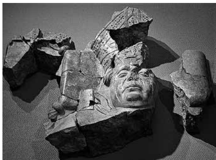
5. Főpapi síremlék töredékei Dombóváról (Novi Rakovac, Szerbia), 15. század harmadik negyede körül, Novi Sad, Muzej Vojvodine