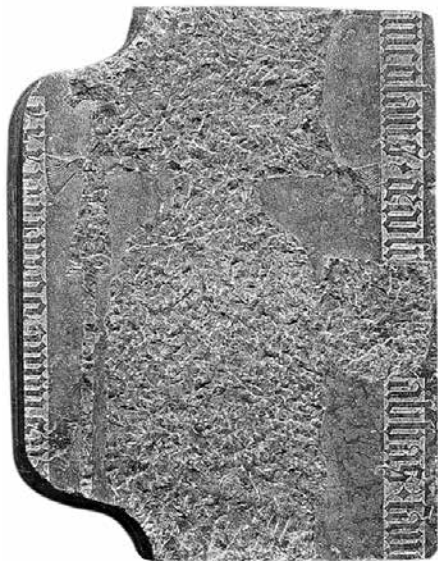
9. Dobói Miklós pannonthalmi apát (†1438/39) sírlapja, Pannonhalma, Főapátság