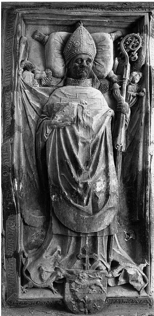
12. Vitéz János esztergomi érsek (†1472) síremléke, 1480 körül?, Esztergom, a Bazilika altemploma

összeállító munkát végző műhelytagokra, és nehéz feltételezni, hogy az oszloptörzsekhez tartozó fejezetek ne a központi műhelyben készültek volna (anyaguk természetudományos vizsgálatára azonban eddig nem került sor, így a Buda környéki mészkövekhez hasonló, a többi vajdahunyadi kőanyagtól eltérő megjelenésük erősen szubjektív vélekedés).