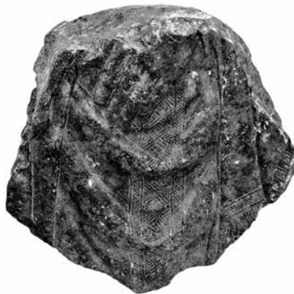
1. Gatalóci Mátyás veszprémi püspök (†1458/59) síremlékének töredéke Veszprém, Laczkó Dezső Múzeum

A veszprémi kőfaragványokat bemutató második közlemény teljes egészében sírkövekkel (illetve egy esetben sírkőnek gondolt, de a szerző utólag korrigált véleménye szerint építészeti funkciójú faragvánnyal) foglalkozott. Egyikőjük, egy körben törésfelülettel határolt töredék domborművű főpapi figura részletét ábrázolja, a hasra fektetett, kereszttel díszített kesztyűbe bújtatott, ujjain gyűrűt viselő bal kézzel. (1. kép) Az ívelten redőzött casula columnáját és az eredetileg a bal karról lecsüngő, rojtos végű manipulus