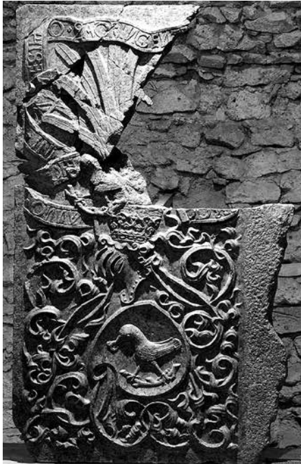
13. A visegrádi oroszlanos falikút töredékes baldachinlemeze, 1483, Visegrád, Mátyás Király Múzeum.