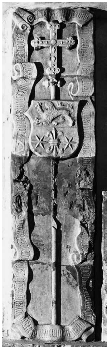
11. Vitéz János esztergomi érsek (†1472) korábbi sírköve, Esztergom, a Bazilika altemploma