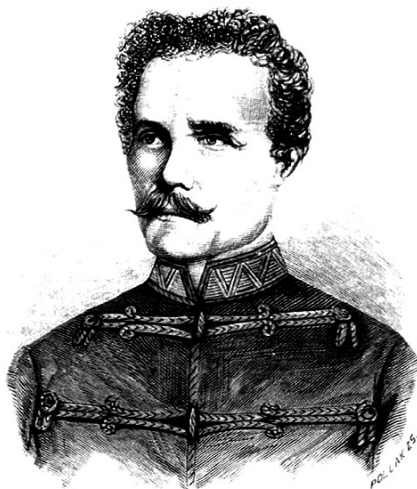
Gábor Áron (1814–1849)

Méltóbb dolog lenne úgy a honvédegylethez, mint Háromszék népéhez ama cselekedet, hogy lenne elég férfiasága számon kérni ama pénzeket, melyeket egyesek lelkesültsége adományozott, de némely kezelők a titok leple alatt