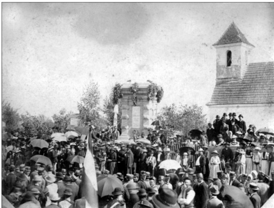
Gábor Áron síremlékének avatója 1892. július 31-én

felgazdálkodtak, s erről az adakozó közönséget nem értesítették