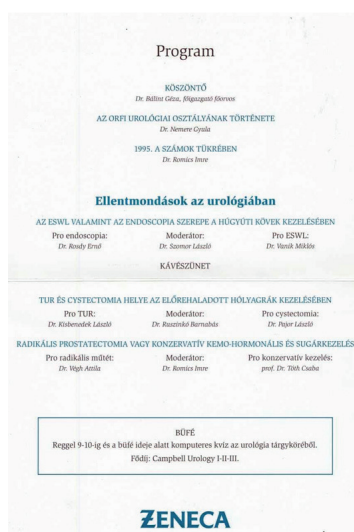
1. ÁBRA: AZ „ELLENTMONDÁSOK AZ UROLÓGIÁBAN” PROGRAMJA 1996-BÓL

Kialakult, és máig is változatlan a kétnapos, tavaszi FUN programja. Általában hazai tekintéllyel kezdjük (ne zavarják a külföldieket a késők) és rendszerint 3 külföldit hívunk meg. Ebéd után folytatódik a program estig. Este bankett, sokszor volt előtte színész, humorista ( pl. Fábry Sándor ), balett vagy más műsor.