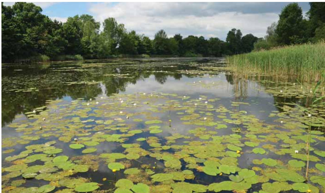
1. ábra. A sulyom ( Trapa natans ) nagy területet borít a holtágon Fig. 1. Water chestnut ( Trapa natans ) covers large areas of the oxbow