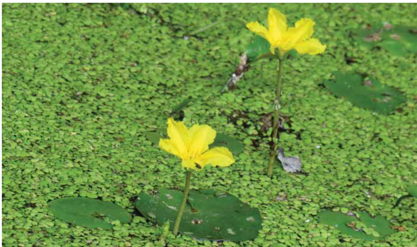
Fig. 12. Yellow water-lily ( Nuphar lutea ) is characteristic species of aquatic vegetation

12. ábra. A vízitök ( Nuphar lutea ) a hínárnövényzet jellegzetes faja