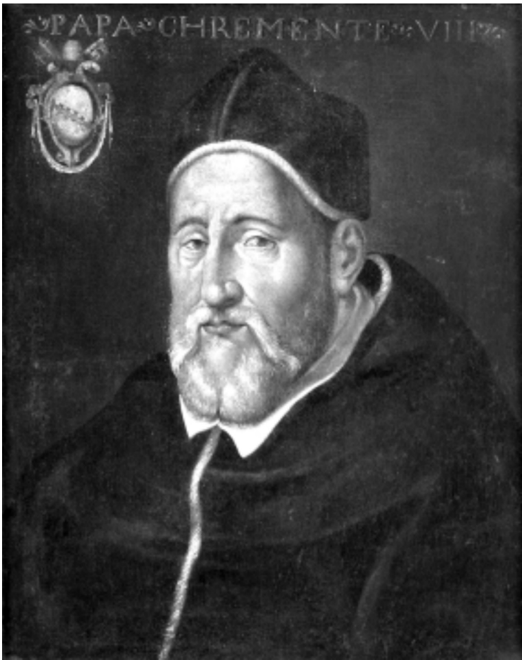
VIII. Kelemen (1592–1605)