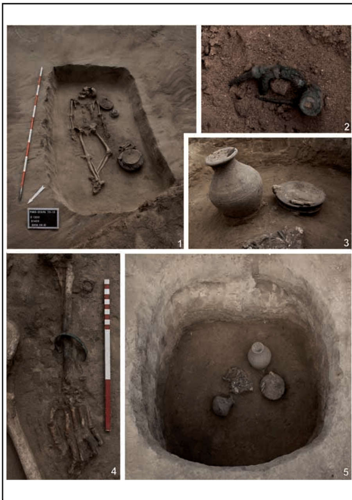
Paks-Gyapa–Vörösmalom-dűlő: 1. 1200. csontvázás temetkezés; 2. bronzfibula az 1201. sírből; 3. 1207. sír edénymellékletei; 4. bronzkarperec az 1200. sírban; 5. 1207. hamvasztásos temetkezés