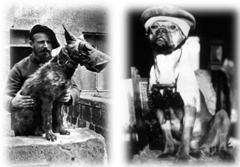
Gázmaszkos hírvívő kutya Franciaországban (bal) 21. kép Német felderítő kutya (jobb) 22. kép

Az információtörténelem, az információs jelenségsalád fogalmi keretrendszerén belül megragadható kutatói kérdésekkel foglalkozó történeti irányzat és szemléletmód nagyon rövid múltra tekinthet vissza (Z. Karvalics, 2004 újabban: Z. Karvalics, 2012), és szövegahagyományában, egyetlen felvetéstől eltekintve, eddig nem is született olyan megközelítés, amely az első világháború és az információtörténelem közös metszetét kereste volna.