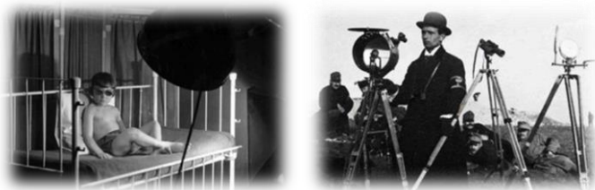
Angolkóros berlini gyermeket kvarclámpával gyógyítanak (bal) 19. kép Fénytvíró használatának oktatása (jobb) 20. kép