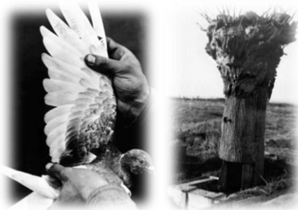
Sorszámozott amerikai hírvivő galamb (bal) 7. kép Hamis fa, brit megfigyelő állomás (jobb) 8. kép

Ha a szórvány-előfordulások és rész-feldolgozások után valaki valóban történeti szintézisre vállalkozna, fél tucatnyi, jól elkülöníthető, különböző kutatási stratégiát és felkészültséget igénylő témáról kellene egyidejűleg illetve összefüggéseiben számot adnia. (A szempontokat épp csak felvillantjuk, majdani kutatások inspirálásának szándékával).