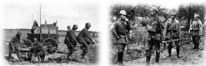
Német kommunikációs csapat (bal) 17. kép Telefonáló német katonák (jobb) 18. kép

Az általános, minden információhordozóra kiterjedő cenzúra-gyakorlat részeként önálló fotócenzúra is működött a front mindkét oldalán. 15 Elsősorban azoknak a képeknek a megjelenését tiltották, amelyeknek a valóságos szörnyűségek és embertelenségek demoralizáló, újoncokat elretentő, a hátszág szemét felnyitó hatásától tartottak. Az amerikai, francia és brit haderőnél az etnikailag sokszínű állomány esetében a rasszizmus-érzékeny asszociációkat kívánták elkerülni.