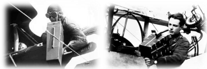
Légi kamera (bal) 11. kép Angol légi fotós (jobb) 12. kép

A frontra küldött vagy engedett fotóművészek mellett a háború szülte meg a hivatásos hadifotóst, mint szakmát. Egyedül a német hadsereg majd félezer profi fényképészt állított csatasorba (Kolozi-Szémann, 2014). A Monarchia hadseregében ennél jóval kevesebb magyar hivatásos szolgált, de éppen ezért a történeti kutatás majdhogynem személyes ismerőssé tudta tenni a legjelentősebbeket: Jelfy Gyulát, az elsőt, a világhírnévig jutó Balogh Rudolfot, 8 a másodikát, majd Nadas Sándort,