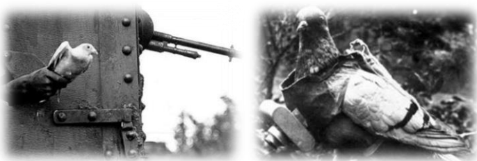
Galamb a fronton (bal) 1. kép Felderítő galamb a testére rögzített könnyű kamerával (jobb) 2. kép

Véleményem szerint két fejlemény érdekes egybeesésének köszönhetjük mindezt: a vizuális dokumentumok forrás-értékét tudatosító fordulatnak, illetve a gyűjteményezés és megosztás újfajta kultúrájának, amely a digitalizálás és a hálózati hozzáférés révén meglepő gyorsasággal alakult ki. Emiatt váltak hirtelen fontossá és megbecsültté a memóriaintézmények meglévő, de eddig csekély jelentőségűnek tartott kollektói, 2 és nőtt meg a kereslet a magánkézben lévő „amatőr” kép-állomány feltárása, megmentése és közkinccsé tétele iránt. 3