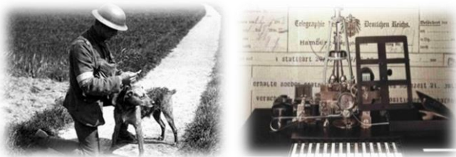
Üzenethozó kutyája (jobb) 9. kép Hughes típusú betűíró távíró 10. kép

(1) A fotográfia korabeli technológiája és a háborús „foto-konjunkturnál” összefüggő innovációk?