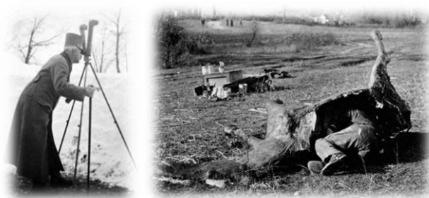
Nagy Pál tábornok a 40. honvéd hadosztály parancsnoka sztereoperiszkóppal (bal) 5. kép Hamis ló, mesterlövészek álcája a senki földjén (jobb) 6. kép

Jól tükrözi mindezt a világsajtót bejáró egyik legszenzációsabb lelet, a Louis és Antoinette Thuillier kollekción sorsa, amelynek üvegnegatívjait egy vignacourt-i parasztház padlásán őrizte egy idős házaspár. A páratlan anyag majdnem megsemmisült az épület eladásakor, mert a tulajdonosok nem voltak tisztában a gyűjtemény értékével. 4 Eközben egy amatőr történész, Laurent Mirouze már húsz évvel ezelőtt (!) felhívta a figyelmet a képek fontosságára, még egy közleményt is megjelentetett, ám akkor evvel még nem tudott semmiféle érdeklődést és figyelmet kiváltani. Most azonban szinte minden világlap foglalkozott a kollekción megmentésével és értékével.