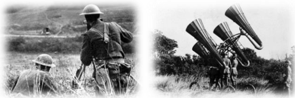
Amerikai tüzérségi megfigyelők (bal) 15. kép Amerikai katonák egy akusztikus lokátorral (jobb) 16. kép