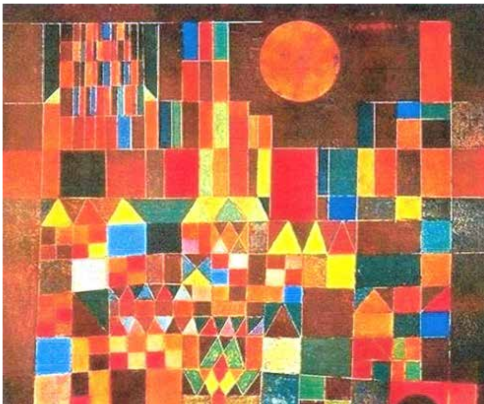
2. ábra. A kastély és a nap, 1929

Paul Klee sajátos, egyéni szellemi jelenség, ami alkotói sikere mellett minket arra figyelmeztet, hogy talán a mi életünknek is lehetnek olyan dimenziói, amelyek rokonai a végtelennek, és hogy ennek gyökerei a természetben és saját lelkünk mélyén rejlenek. „A művészet öntudatlan játékot űz a végső dolgokkal, és mégis eléri őket!” – írja az Alkotói vallomás ban. Ez az ő spiritualitásának a háttere. Nem misztika, hanem a valóság szerelme. Ez pedig nem az elmúlásra, hanem az alkotás szellemi gyökereire utal, aminek érvényesülését akarni nem, csak engedni lehet. Engedjük hát, hogy Paul Klee szelleme minket is megtermékenyítsen!