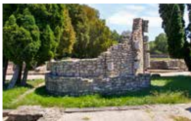
17. ábra. Aquincum-polgárváros, halpiac, (macellum) mérlegház