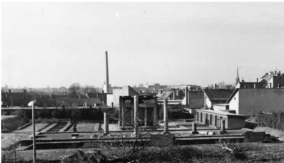
19. ábra. A szombathelyi Iseum quasi anastylosis 1964-ben

re mind a mai napig lelkesen emlékeznek az egykori táborlakók. Sebő Ferentől Rajk Lászlóig, Fejérdy Tamásig hosszú a hazai résztvevők névsora. Majd az 1980-as évektől a 120 fős évfolyam számára szervezett történeti városfelmérések sora következett. Így tölthettek felejthetetlen két hetet a másodévesek Baján is 1981 nyarán.