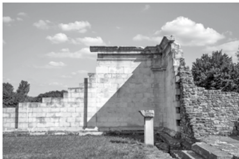
15. ábra. Aquincum, polgárvárosi fórum nyugati fala