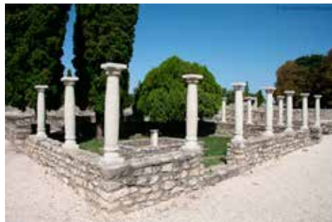
16. ábra. Aquincum-polgárváros, Collegium Iuventutis helyreállított oszlopsora