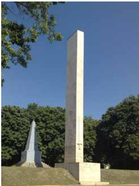
2. ábra. Baja, Déri-kert, I. világháborús emlékmű