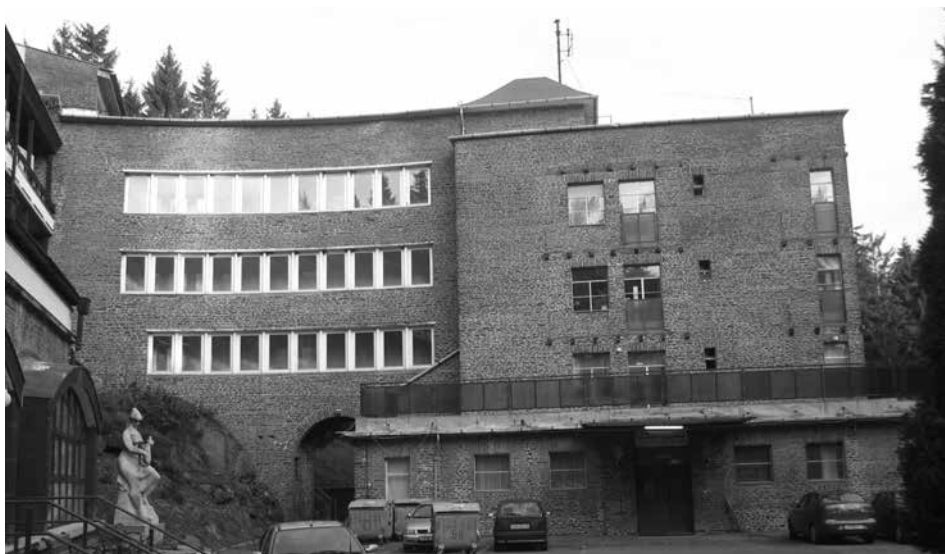
9. ábra. Mátraháza, szanatórium, összekötő szárny

lenül a korszerűnek vélt gondolat megjelenését tükrözi. Az erőteljesen tagolt tömeg, a főhomlokzaton megjelenő markáns szegmensíves nyíláskeretezés talán inkább a hagyományok megtartásának szándékára utal. Az ironó „Meseháznak” nevezte az épületet. 1937-ben bekövetkezett haláláig gyakorlatilag Mátraházán élt 8 (10. ábra).