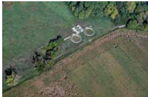
24. ábra. Fenékpusztán, a refugium település bejárati kaputornyainak részleges rekonstrukciója