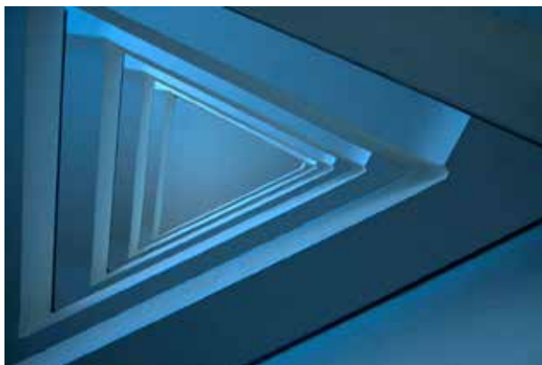
5. ábra. Budapest, Szerb u. 17–19. bérház lépcsőháza

Miskolczy László néhány épülete is ismert Budapesten. A Csonka családhoz fűződő korai kapcsolatát igazolja, hogy az építési vállalkozó Csonka László részére 1928–1929-ben épített egy villát a Gellért-hegyen, a Kelenhegyi út 37. szám alatt. Bolla Zoltán véleménye szerint a lakóház art deco jegyeket visel magán. 6 A Korbuly testvérek számára egy bérháza épült 1937-ben a Szerb utca 17–19.-ben (5. ábra).