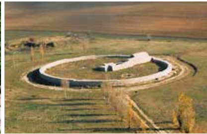
22. ábra. Baláca, Likas-domb – tumulus bemutatása