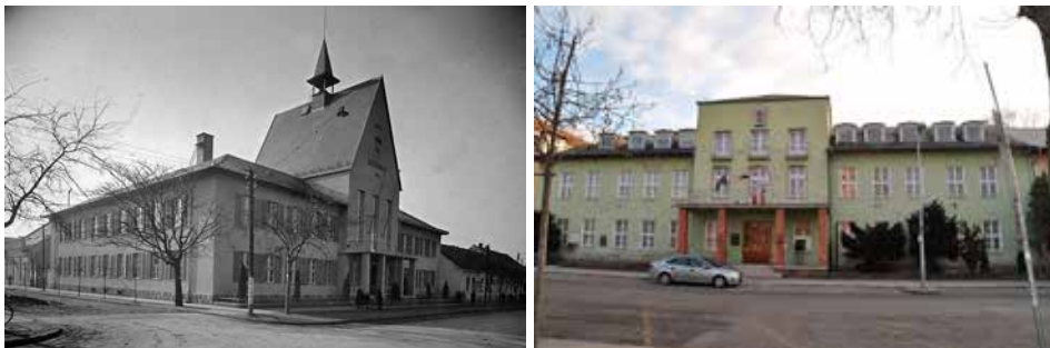
6.a–b ábra. Budapest, XXI. kerületi Városháza egykor és ma