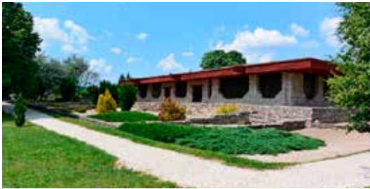
21. ábra. Baláca, villagazdaság, I. épület

tató, négy nyelven publikált útikönyvet állított össze a hazai római koros régész szakma közreműködésével. 33 Persze újabb és újabb feladatok megoldására is hívták, és boldogan mentem vele. Gorsiumban Fitz Jenőnek készíthettük el az egykori település bemutatásának távlati fejlesztési tervét. Ennek megvalósításán ma már sajnos csak egyedül kell dolgoznom. Gyakran megfordultunk a Veszprém közeli Baláca pusztán, a sok problémával küzdő villaépület hibáinak kijavítása (21. ábra) és a Likas-dombnak nevezett halomsír bemutatásának (22. ábra) tervezése miatt. Kővágószőlős egykori mauzóleumának védelmét a Mecseki Uránbánya Vállalat megbízásából és kivitelezésében készítette el. A maga idejében izgalmas cella memoriae bemutatása a bánya bezárása után a vandálok pusztításának vált áldozattá (23. ábra). Fenékpusztán Müller Róbertnek, a Balaton Múzeum igazgatójának hívására készítettünk programot a refugium település életre keltése érdekében (24. ábra). Dunafüreden a fürdő fölé emelt védőépület megújítására összeállított vázlatok – Poroszlay Ildikó váratlan halála miatt – a soha meg nem valósult tervek sorát