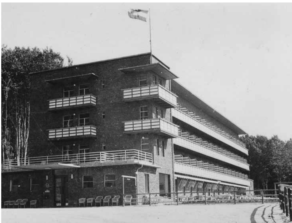
7. ábra. Mátraháza, szanatórium, A épület