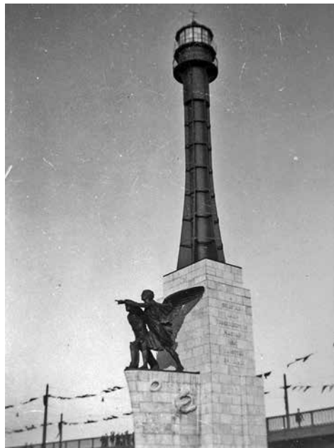
3. ábra. Haditengerész emlékmű a Petőfi (egykori Horthy Miklós) híd budai hídfőjében