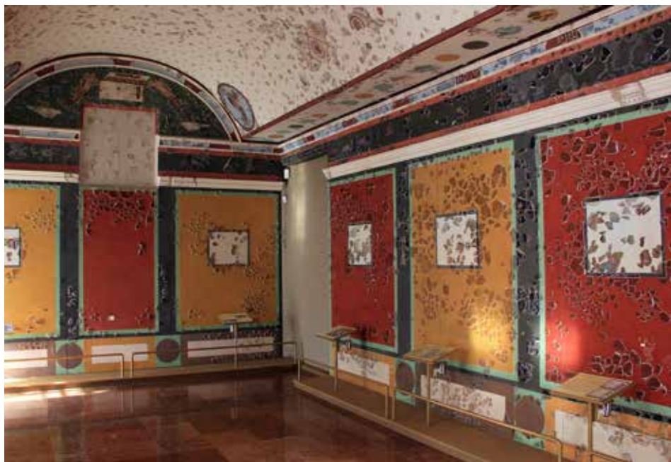
20. ábra. A Brigetióban feltárt falfestményes római szoba bemutatása a tatai várban