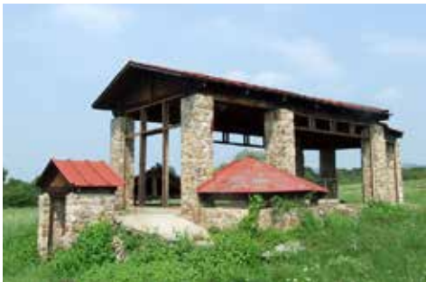
23. ábra. Kővágószőlős, az egykori helyreállítás látványa napjainkban