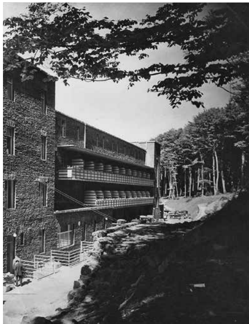
8. ábra. Mátraháza, szanatórium, B épület

is a második, mai jelöléssel „B” épületet (8. ábra) és 1943-ban a két elem kapcsolatát biztosító íves összekötő szárnyat (9. ábra).