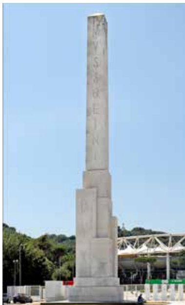
4. ábra. Mussolini Dux obelisc a római Foro Italicón