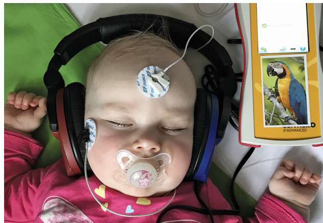
1. ábra Szűrő BERA-vizsgálat. A fejbőrrre helyezett elektródák segítségével regisztráljuk a hanginger által kiváltott agytörzsi válaszokat

Magyarországon évtizedek óta kötelező a hallásszűrés 0 és 4 napos kor között, annak idején azonban ez kevésbé megbízható, szubjektív módszerekkel történt. Ezért már az 1990-es évek óta voltak regionális törekvések a szűrés objektív módszerrel történő megvalósítására. Egyes újszülöttsztyályokon a belső fül működését regisztráló otoakusztikus emisszió mérést végeztek [14–16]. Az Emberi Erőforrások Minisztériuma 2015-ben módosító rendeletet adott ki az újszülöttkori hallásszűrésről, mely kötelezővé teszi minden megszületett gyermeknél 0–4 napos korban az objektív hallásvizsgálatot [17, 18]. A kiadott szakmai irányelv szerint minden újszülöttnél szűrő BERA- (brainstem evoked response audiometry – agytörzsi kiváltott válasz audiometria) vizsgálat elvégzése szükséges [19] (1. ábra). Az agytörzsi kiváltott válaszok regisztrálása biztosítja csaknem a teljes hallórendszer működésének vizsgálatát, így szinte mind egyik típusú halláscsökkenés esete kiszűrésre kerülhet [20]. A hangvezető rendszer, a belső fül és a hallópálya betegsége esetén nem kapunk megfelelő eredményt.