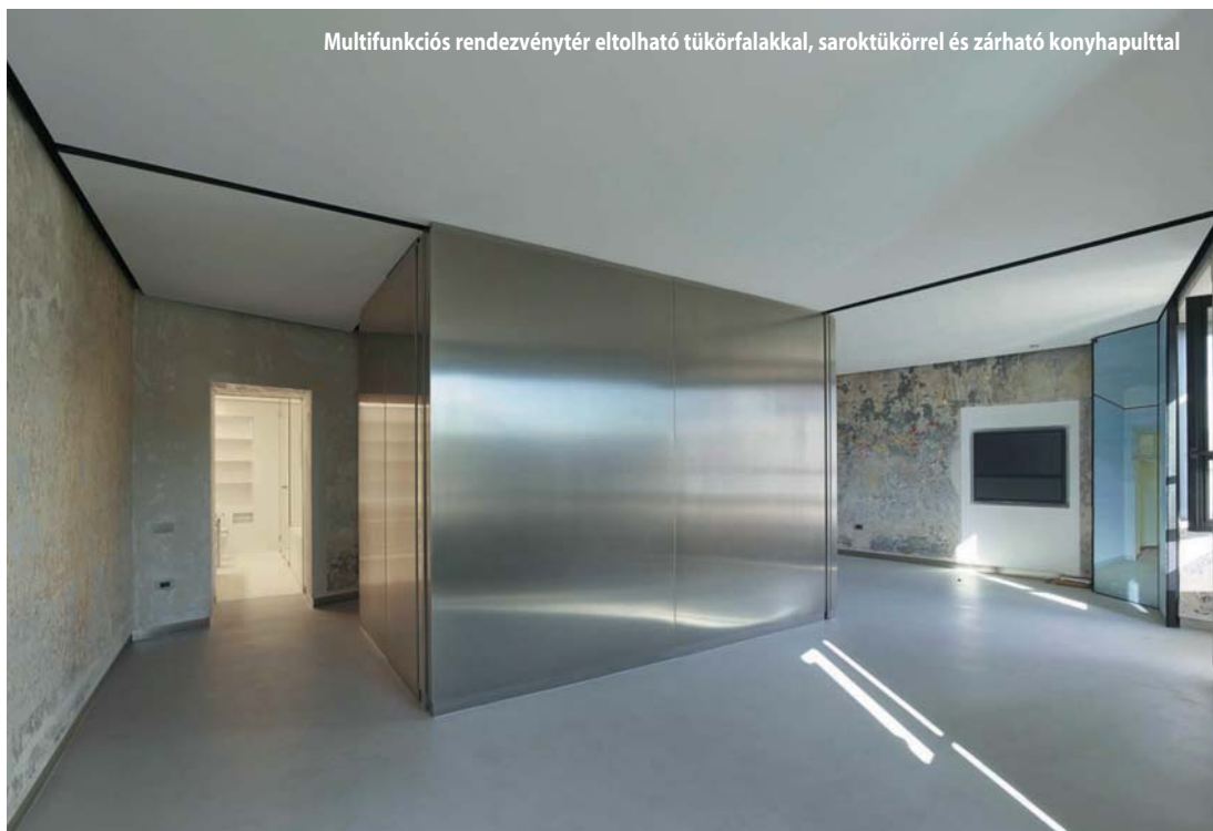
Multifunkciós rendezvénytér eltolható tükörfalakkal, saroktükörrel és zárható konyhapulttal

A három bérház belsejét közös udvar és az emeleten körfolyosó köti össze. Bejuthatunk közvetlenül az utcára nyíló több kiállítótéren keresztül is. A kirakatként feltáruuló szalonok részei az ókori piactérnek, a szegélyező járdák Sampietrini kőburkolata az épület falsíkján belül is folytatódik. Miután e meghívásnak engedtünk, dönthetünk úgy, hogy utunkat az emelet felé folytatjuk. A körfolyosós átrium körül minden irányban találunk