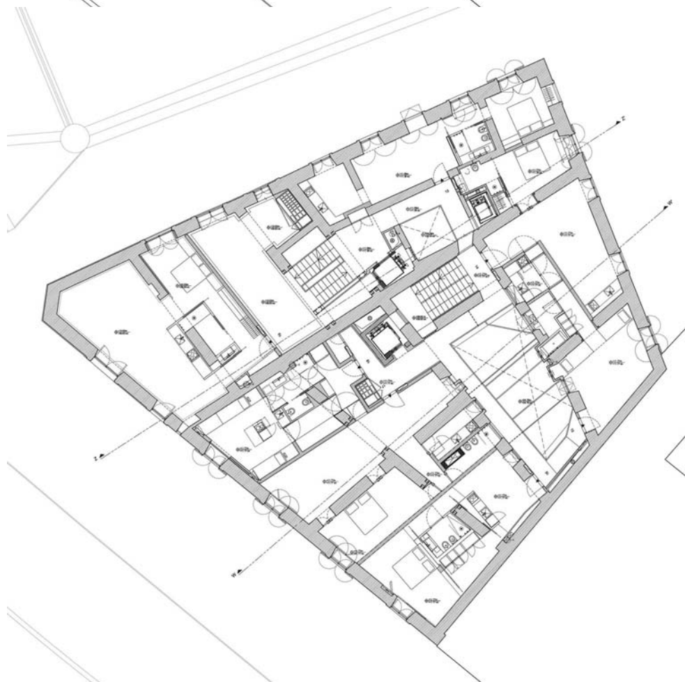
Piano nobile, emeleti alaprajz