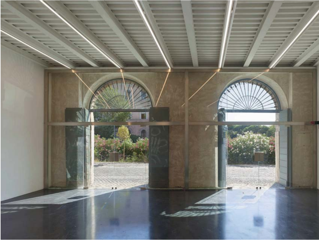
Bejárat az egyik földszinti galériába. Köztér és enteriőr egymás kiterjesztései