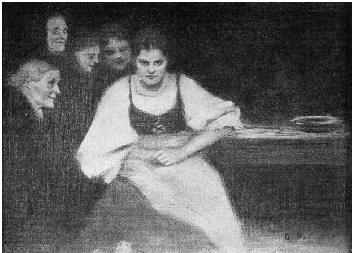
Iványi Grünwald Béla: Rab asszony

Ha hihetünk Jókai Mórnak, az illusztrált költeményekből (azt nem tudni, hogy melyik kiadásból) egy év alatt tizenkétezer példány fogyott el. 27 Az Athenaeum egyébként a kevésbé tehetős vevőkre is gondolt, részükre háromféle, részletekben fizethető, illetve olcsóbb kiadásváltozatot adott közre. A felfokozott érdeklődés egyértelműen a nemzet legnépszerűbb poétájának szólt. Az egyik hírlapíró néhány évvel korábban meg is jegyezte, hogy ha irodalmi illusztrációról van szó, akkor a magyar művészek legszívesebben Petőfi verseihez készítenek grafikákat. 28