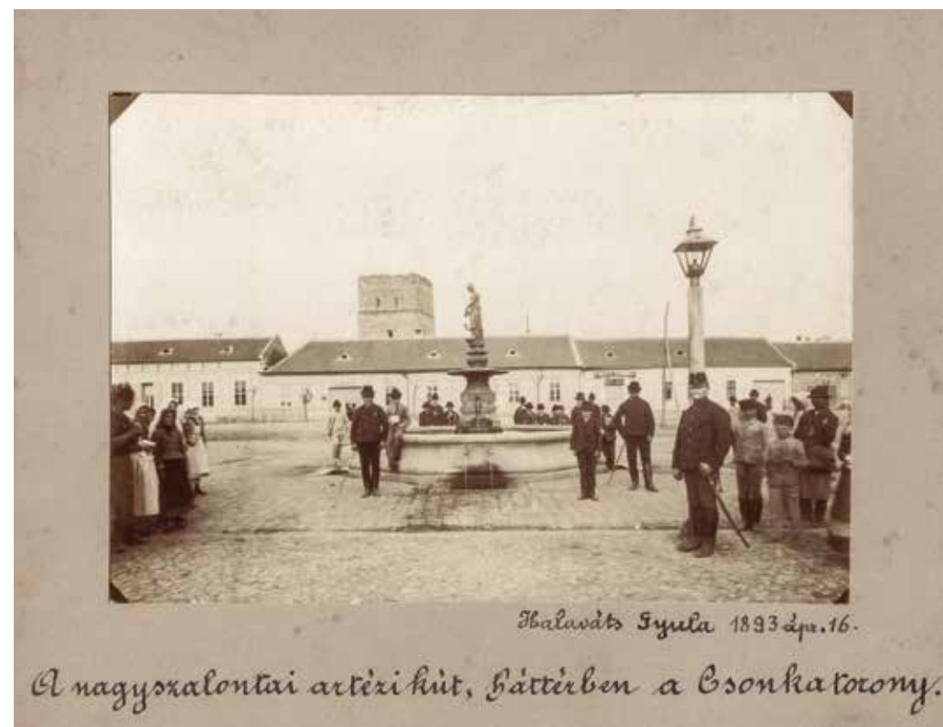
A Csonka torony 1893-ban

a felálló emlékegyesület azonban hiába indított gyűjtést, adósságait nem sikerült rendezni, s rövid távon nem látszott esélye a torony felújításának