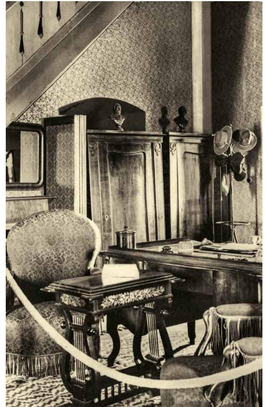
A kiállítás a két világháború között

A helyiek számára a történet, a múzeum alapításának története még egyáltalán nem zárult le – ennek a folyamatnak a következő állomása lett volna Arany 100. születésnapjának látványos megünneplése.