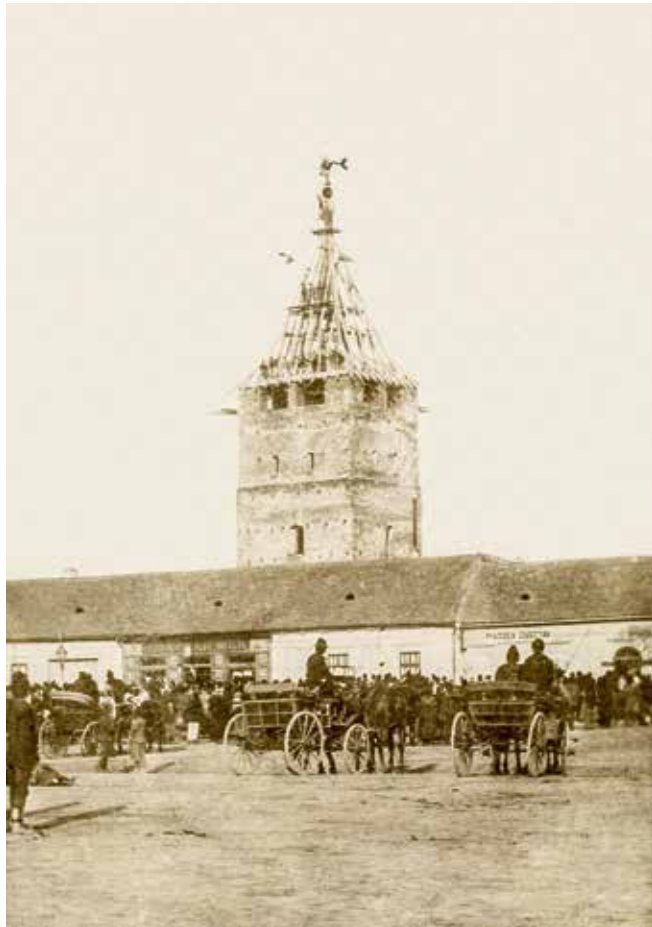
A torony felújítása 1898-ban

T Arany János nagyszalontai kultusza nem a költő halála után indult. A város már 1856-ban olajképet rendelt neves szülőttéről Barabás Miklóstól. 1 Mindössze négy esztendő telik el tehát Arany távozása és az első figyelemre méltó kultikus tiszteletadási forma között. Mindazonáltal nyilván Arany János 1882-ben bekövetkezett halála után indulhatott el az a folyamat, amelynek során a város végérvényesen emlékezetpolitikájának középpontjába helyezhette a költő alakját. A továbbiakban ennek az emlékezetpolitikának az alakulását tekintem át röviden.