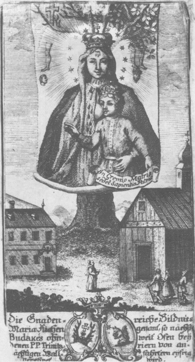
Budakeszi – Makkosmária. Imalap – 1748 k. – rézmetszet – 110x62 mm (lapméret). Dubay Miklós gyűjteménye, Budapest.