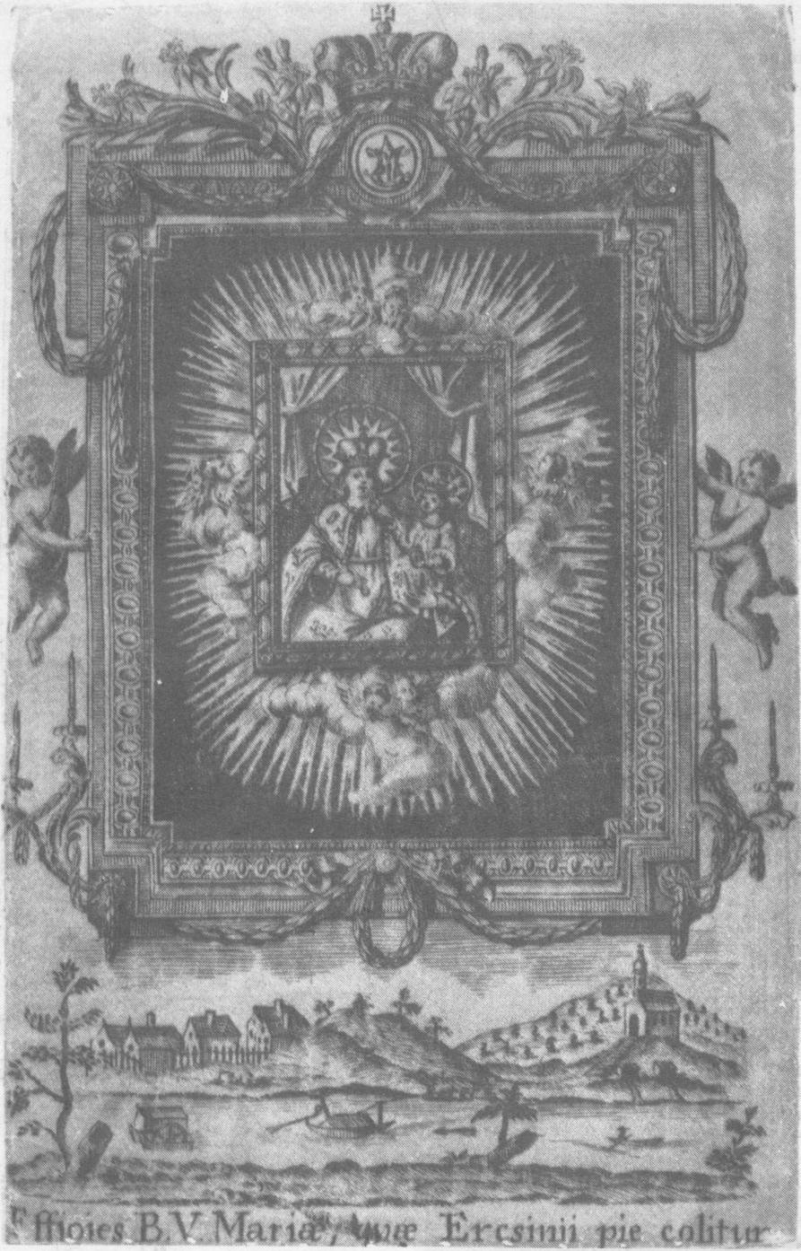
Ercsi. Szentkép – 1780 k. – rézmetszet, rózsaszín selyem – (Binder-műhely) – 157x100 mm (lapméret). Budapesti Történeti Múzeum, Újkori osztály, Metszettár, 46. sz. gyűjtő. sz. n.