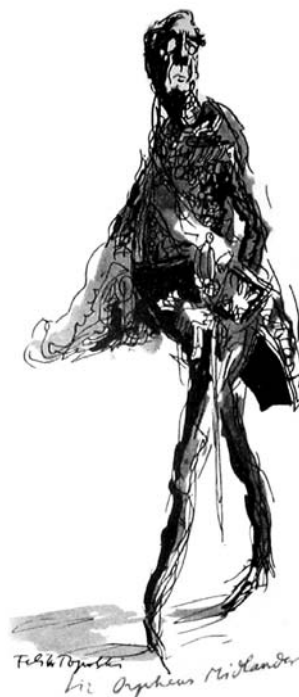
Sir Orpheus Midlander

Mentre il primo atto presenta le colpe gravi, il secondo atto è la preparazione della Lega delle Nazioni, cioè da parte dell'organizzazione internazionale, al 'processo' contro i dittatori: sono le conseguenze 'inaudite' (sempre in chiave molto ironica) dell'atto della piccola segretaria pigra e stupida, che ha preso letteralmente il compito dell'organizzazione, conquistandosi una fama e una popolarità inaudite fra la gente e sta già ascendendo come rango sociale, sia grazie al suo fidanzamento felice con il nipote del ministro degli esteri, aristocratico anche lui, sia in quanto candidata (per sostituire il fidanzato che si ritira volontariamente) a diventare «da-