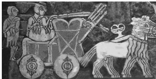
2. ábra: Sumér székér ábrázolása.

A kezdetleges harci kocszi óriási mértékben megnövelte a harcoló sereg manőverező képességét, ugyanakkor felvetette az összehangolás igényét és ezzel jelentősen megnövelte a hadvezér szerepét (Nagy, 2014).