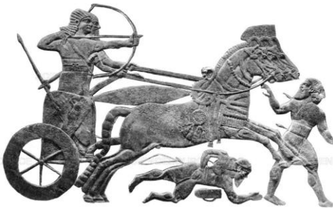
1. ábra: Asszír harciszekér.

A műszaki csapatoknak köszönhetően az asszír hadsereg rendkívül magas színvonalú ostromtechnikát alkalmazott. Ostromtechnikájuk alapelveiben (körülzárás és roham kombinációja), valamint egyes technikai eljárásaiban (faltörőkos, ostromtorony, ostromlétra) példaképévé vált a perzsa, majd később