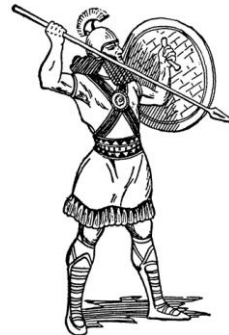
2. ábra: Asszír harcos.

E hét gyalogos fegyvernem mellett kezdetben két lovas fegyvernem (reguláris és testőr/páncélos) volt, de a páncélos íjász és páncélos lándzsás lovasság mellett a szintén páncélos testőrlovassággal, továbbá reguláris – valószínűleg páncélozatlan – lovassággal együtt legalább négy lovas fegyvernem léte-