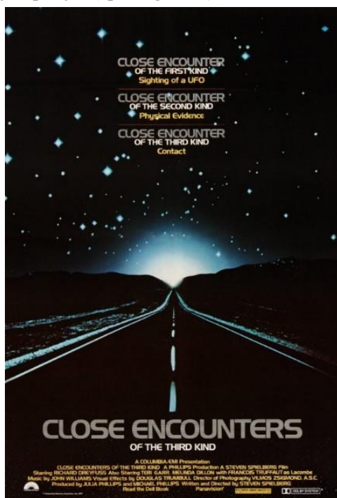
3. ábra: A Harmadik típusú találkozások c. film posztere (Spielberg, 1977)

lyen technikai eszközeik lehetnek, hanem azt is, hogy a (főként: USA-beli) kormányzati szervek hogyan kísérelnék meg titokban tartani saját állampolgáraik előtt is az esetet.