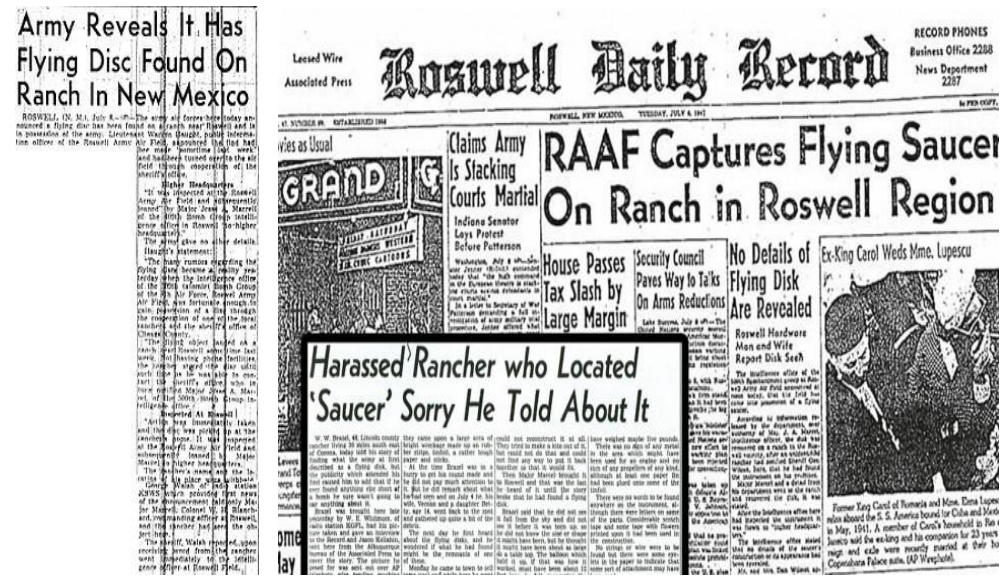
1. ábra: a The Sacramento Bee és a Roswell Daily Record újságok 1947. július 8-i hírei (forrás: The Sacramento Bee, 1947; Roswell Daily Record, 1947)