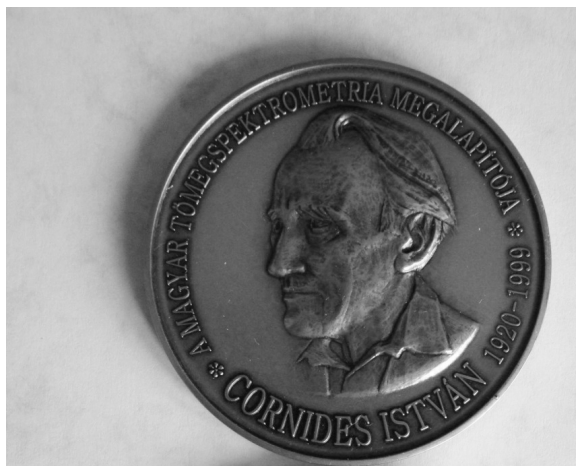
8. ábra. A Magyar Kémikusok Egyesülete Tömegspektrometriai Társasága által alapított „Cornides István Tudományos Díj” emlékérmé (Albrecht Júlia alkotása).

A következő táblázat a Cornides István Tudományos Díjjal, 2011 és 2018 között kitüntetettek listáját mutatja be.