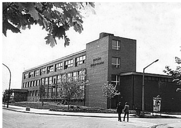
3. ábra. Kazincbarcikai Vegyipari Műszerelési és Automatizálási Technikum