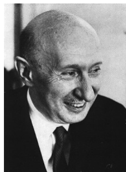
1. ábra. Békésy György

Munkabírása, elméleti és gyakorlati problémák megoldása iránti fogékonysága már fiatal éve alatt megnyilvánultak. 1942-től a Gyakorlati Fizikai Intézetben a később Nobel-díjjal kitüntetett Békésy György (1. ábra) munkatársa, díjtalan tanársegéd, ahogyan írta „afféle előtornász, akinek a tanár megmutatja az új fogásokat, hogy adja tovább és gyakoroltassa be a többiekkel”. Békésy György ekkor dolgozza ki az egyetem számára a kísérleti és gyakorlati fizika korszerű tanításának koncepcióját és kezdi meg annak bevezetését. Ehhez választja munkatársaként Cornides Istvánt (demonstrátorként). 1,2