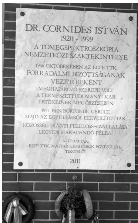
7. ábra. Cornides István emléktáblája az ELTE Aulájában.

Cornides István fizikusként, az ELTE Fizikai Intézetében töltött évei alatt részt vett a vegyészképzés elindításában is, vegyész hallgatóknak laboratóriumi gyakorlatokat szervezett. Hallgatóként a csoportjába felvételt nyerni kiváltságnak számított. Olyan kiváló kutatók képzését segítette, mint Kálmán Alajos, Andy Grove, Nágel Ferenc, Opauszky István. Munkássága óta a tömegspektrometria fókuszpontja a fizika helyett a kémia és a biokémia területére helyeződött át. Bár emléket az ELTE Természettudományi Karán tábla őrzi (7. ábra), az ELTE Kémiai Intézete egy, a nevét viselő kutató-oktató laboratórium megalapításával is szeretne munkásságának méltó emléket állítani.