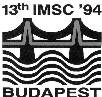
6. ábra. A Budapesten megrendezett 13. International Mass Spectrometry Conference (IMSC) logója (Andor András munkája).

Ezzel együtt olyan – több mint ezer résztvevős – konferenciát sikerült szerveznünk (elnézést, de Pista bácsi volt a Szervező Bizottság elnöke, én pedig a titkára L. L.), amire a mai napig szeretettel emlékeznek a résztvevők (5 - 6. ábra).