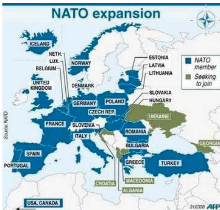
12. ábra. A NATO terjeszkedése