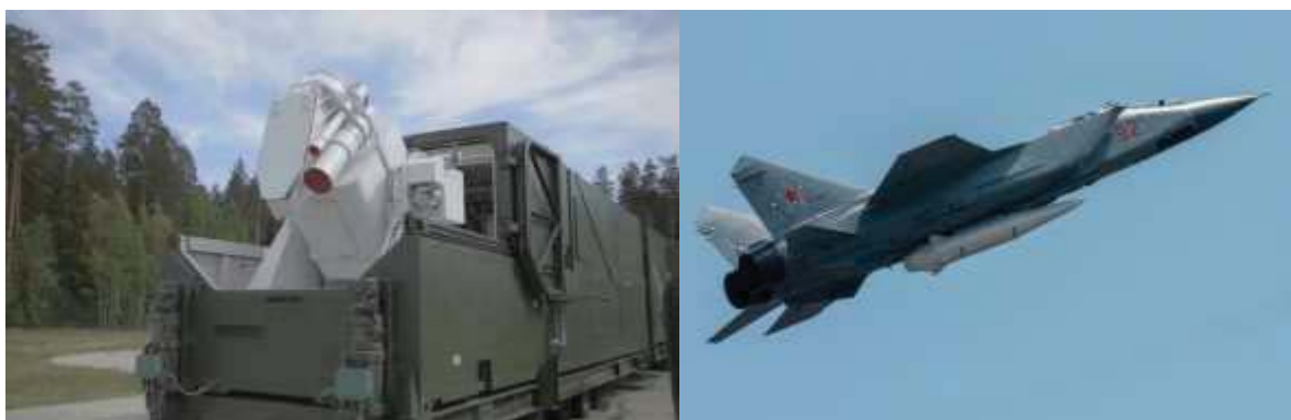
6. ábra. Peresvet lézerefegyver

https://www.globalsecurity.org/wmd/world/russia/images/avanguard-image04.jpg (Letöltve: 2019.02.25.)