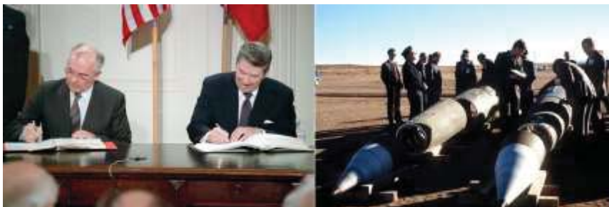
2. ábra. Gorbacsov és Reagan aláírják az INF szerződést

A szerződés 1988. június 1-jén lépett életbe, miután május 27-én az amerikai szenátus elfogadta, majd Reagan és Gorbacsov aláírták június 1-jén a moszkvai találkozón. A szerződésben foglaltak alapján, az érvénybe lépést követően, 90 nap áll a részes felek rendelkezésére, hogy telepített rakétáit, és 12 hónap arra, hogy a nem telepített rakétáit is felszámolja. 4 5 6