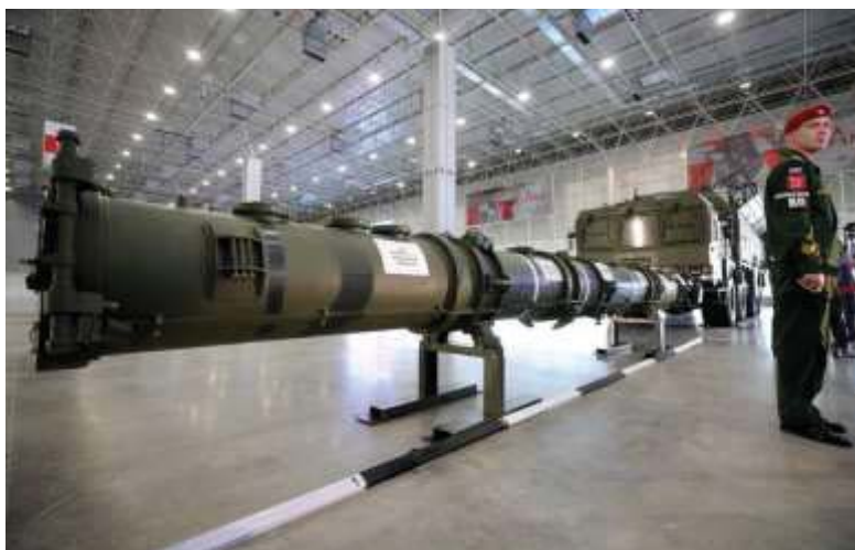
9. ábra. A kiállított 9M729-es rakéta

Kína stratégiaileg nagyobb veszélyt jelent az Egyesült Államokra, mivel a kínai rakéták már telepítve vannak, az Oroszországi Föderáció, még ha rendelkezik is ilyenfajta fegyverrel, azok telepítve nincsenek. Európában NATO tagállamok sorakoznak rakétavédelmi rendszerekkel felszerelve (Románia, hamarosan Lengyelország is). Az amerikai befolyás az európai térségben jelentősebb, mint Ázsiában, így nagyobb fenyegetést jelent az oroszok számára. Ázsiában és a Közel-Keleten az amerikai jelenlét nem kívánatos, Irán és Szíria Amerika ellenes, Kazahsztán Oroszországot részesíti előnyben az amerikaiakkal szemben, Afganisztánban is kérdéses az USA támogatottsága. Az Egyesült Államok támogatottsága, az ázsiai földrészen veszélyben van. Mindezek ellenére az orosz fenyegetéstől zeng a sajtó és a nyugati politika. Ennek feltételezhető oka a történelmi múltra vezethető vissza. A XX. században folyamatosan zajló orosz/szovjet ellenes propaganda, miatt igencsak egyszerűen és nagy hatékonysággal lehet az Oroszországi Föderációt a fenyegetés, veszély megtestesítőjévé alakítani. Egyszerűbben elérhető, mint a kínai fenyegetettségi percepciót az emberiség tudatába bevinni. 26