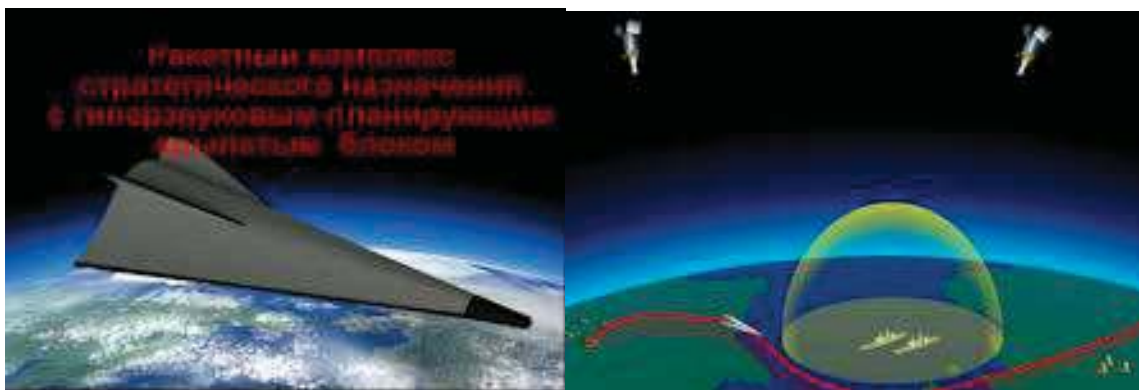
4. ábra. Az új orosz fegyver, az Avangard