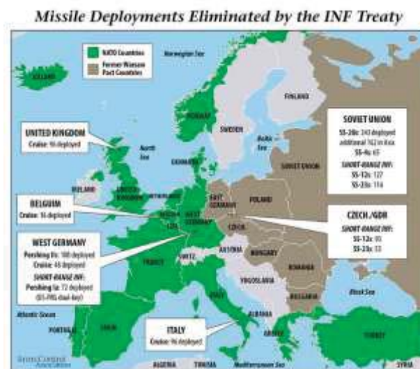
1. ábra. A telepített rakéták, amiket megszüntetett az INF szerződés.

https://www.armscontrol.org/sites/default/files/images/Factsheets/INF_Treaty_Map1.jpg