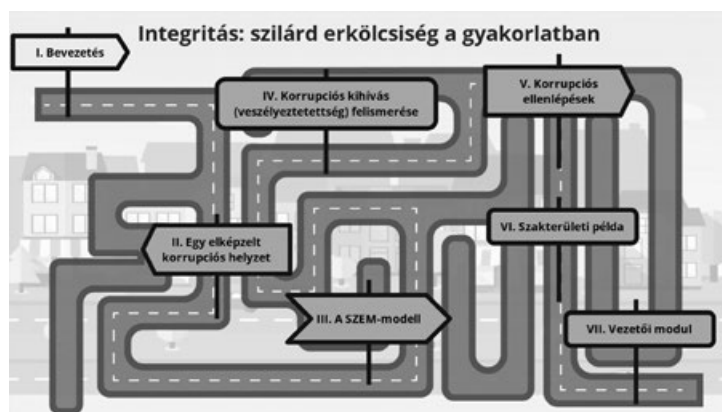
3. számú. ábra: az „Integritás: szilárd erkölcsiség a gyakorlatban” című képzés központi oldal (képernyőkép, hivatkozás ld. 18. lábjegyzet)

Az elkészült képzés céljai között szerepelt, hogy a 21. század digitális átalakulásához, az Y és Z generáció informatikai- és életpaszatalához jobban illeszkedő feldolgozási móddal segítse a tananyag alapjául szolgáló tudományos kutatási eredmények megértését. Cél volt, hogy az e-tananyag ne csak száraz kognitív tényeket, fogalmakat és definíciókat közvetítsen, hanem az egyének kognitív sémáihoz, gyakorlati tapasztalataikhoz jól illeszthető, személetes és életszerű módon járuljon hozzá az etikus, a szilárd erkölcsiségnek és az integritás követelményeinek egyéni és szervezeti szinten egyaránt megfelelő viselkedéshez. Ennek a célnak az eléréséhez a gamifikációs technikák alkalmazása tűnt a leghatékonyabbnak a képzés kialakításakor. Ezért a résztvevő a köszöntés után egy központi „játékfelületen” találja magát, ahova az egyes modulok elvégzése után mindig visszatér (ld. 3. számú ábra), s így követni tudja haladását az úton 18 .