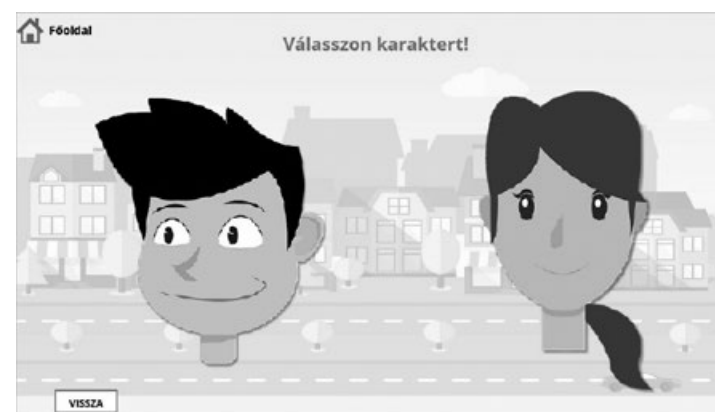
4. számú. ábra: „Integritás: szilárd erkölcsiség a gyakorlatban” című képzés: karakterválasztás (képernyőkép, hivatkozás ld. 18. lábjegyzet)

Pl.: „Ha a választott karakterem férfi, pedig én nő vagyok, más neve van, és más területről is érkezett, mint én, akkor az „általa” megjelölt vélemények látszólag nem azonosak az én véleményemmel, ezért rólam ez alapján adat nem gyűjtethető, ellenem eljárni a korrupcióval kapcsolatos attitűdöm miatt nem lehet.” 22