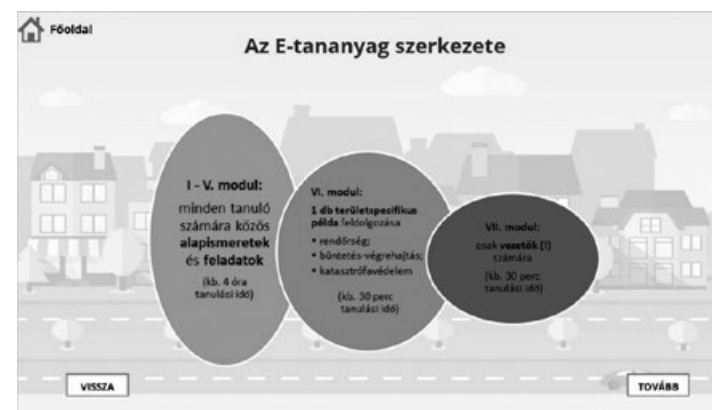
2. számú. ábra: az Integritás: szilárd erkölcsiség a gyakorlatban című képzés szerkezete (képzési képernyőkép 17 )

A képzés céljaihoz illeszkedve szükség volt az elméleti ismeretek átadására, többféle szakterületi helyzet bemutatására, a korrupciós helyzet felismerését, elkerülését vagy éppen az ellenlépések megtételét szolgáló képzési szakaszra, és egy, csak a vezetők számára kialakított tananyagrészk elkészítésére is. Ennek érdekében végül a 2. számú ábrán látható képzési struktúra került kialakításra 16 .