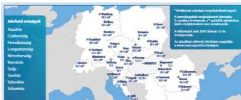
6. ábra. A legnépszerűbb úticélok, ahová interneten is váltható jegy (2019)

Az elektronikus jegyértékesítés a nemzetközi trendeket követve 2011 végén indult el. Kezdetben a minőségi távolsági vonatokon (IC, EC, EN, Expressz) volt lehetséges a jegyek interneten történő megvásárlása, otthoni nyomtatása vagy elektronikus bemutatása (6. ábra). A gyorsvonati pótjegyek bevezetés után a sebes és gyorsvonatokra is kiterjesztették az elektronikus bemutatás lehetőségét.