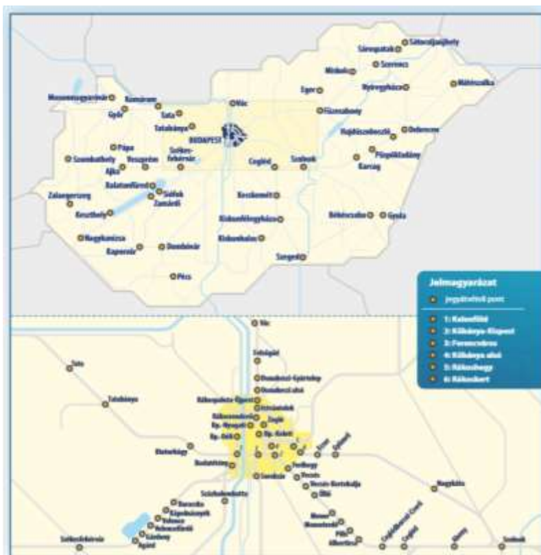
7. ábra. MÁV-START Zrt. jegyvételi pontok (2019)