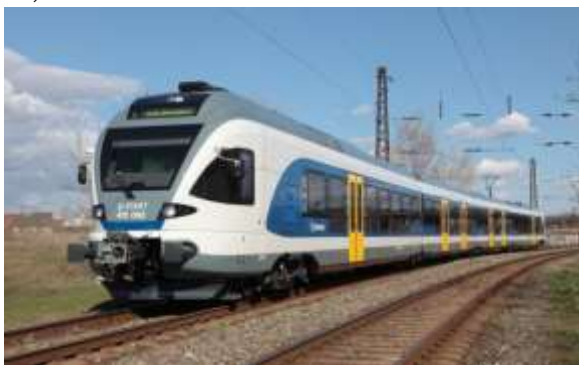
1. ábra. FLIRT motorvonat

A legsikeresebb ilyen beszerzés a svájci gyártmányú FLIRT motorvonatok beszerzése volt, amely során 102 db járművet állítottak forgalomba, főleg a budapesti elővárosi forgalomban (1. ábra).