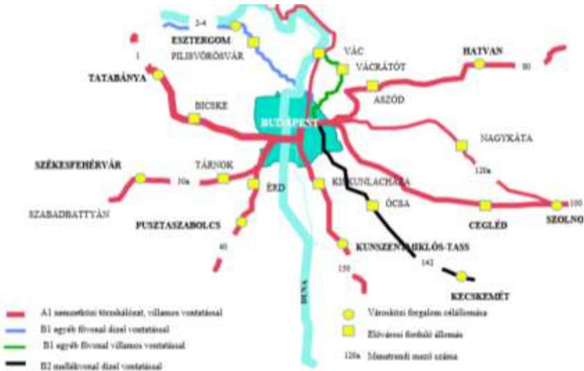
3. ábra. A budapesti agglomeráció vasúti közlekedése