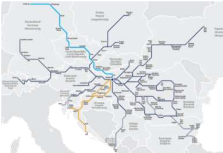
4. ábra. MÁV-START nemzetközi hálózata (2019)

A nemzetközi forgalomban új és felújított járművek segítségével biztosítják a kényelmes utazást. Év közben a legjelentősebb viszonylatok a Budapest-Pozsony-Prága-Berlin-Hamburg, illetve a Budapestről Lengyelország, Ukrajna, Románia, Szerbia, Horvátország felé közlekedő járatok. A nyári időszakban célvonatokkal igyekeznek kiszolgálni az Adriai-tengerhez igyekvő nyaralók igényeit.