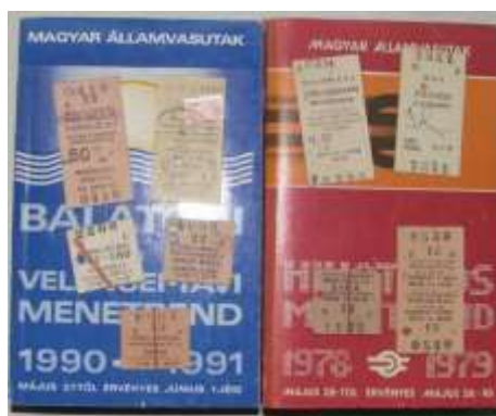
5. ábra. Papíralapú vasúti jegyek az 1970-es években

Az elmúlt években a MÁV-START Zrt. jegyértékesítése jelentős fejlődésen ment keresztül. Az 1970-es évek papíralapú vasúti jegyét az 5. ábra szemlélteti.