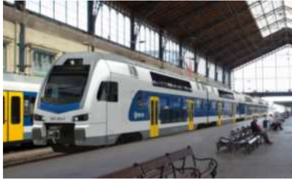
2. ábra. KISS motorvonat