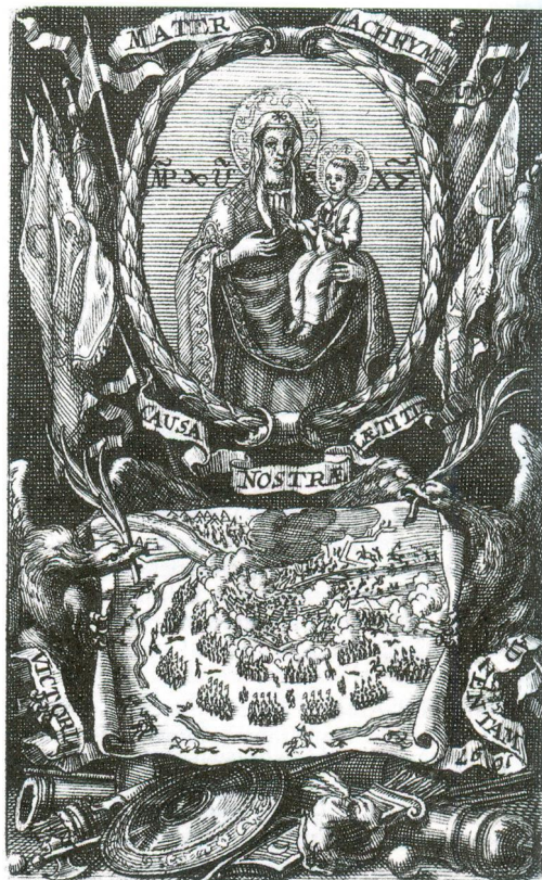
Máriapócs, Gnadenbild als Symbol des Sieges bei Zenta, Kupferstich, 1698

Das heute in M. verehrte Bild ließ János Telekessy, Bischof von Eger, 1707 in Wien malen und anstelle des Originals anbringen. Diese Kopie weicht von dem Wiener Original in einem wichtigen Detail ab: Das Jesuskind hält auf dem Wie-