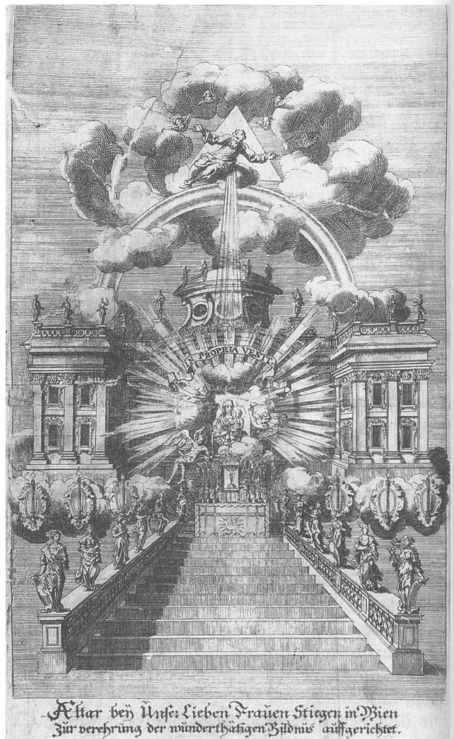
Fig. 1: Abgetrocknete Thränen . Nürnberg–Frankfurt 1698, ausfaltbares Frontispiz: „In propria venit“, Kupferstich, 327 x 191 mm

Die einführenden Rahmentexte des Buches umfassen 34 unpaginierte Seiten und bestehen aus der unmittelbar auf die Widmung folgenden Vorrede an den Leser, aus den inhaltlichen Zusammenfassungen der Diskurse sowie aus dem sog. Directorium, einer Anweisung zum praktischen Gebrauch der Sinnbilder. Danach folgen die 35 Diskurse auf 456 Seiten. Den Anfang eines jeden Diskurses schmückt ein in Kupfer gestochenes, von einem Kranz aus Eichenblättern umrahmtes Sinnbild. Die lateinisch-deutschen Motti wurden zusammen mit den Bildern gestochen und außerhalb des Rahmens kreisförmig angeordnet. Der Stecher der Sinnbilder ist ebenso unbekannt wie der des Vorsatztitels. Die mehrgliedrigen Kompositionen aus Bild und Text weisen jeweils dieselbe Struktur auf: Benennung der Serienzahl mit Worten; Zusammenfassung der Bedeutung des Emblems in einem Satz; die bildliche Darstellung mit dem Motto; eine vier- bis achtzeilige lateinisch-deutsche Explicatio in Versen; Wiederholung des Mottos auf jeweils neuer Seite, im Sinne eines