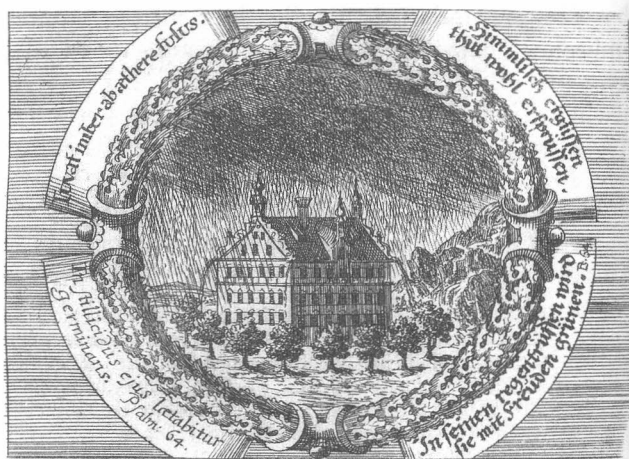
Fig. 3: Abgetrocknete Thränen. Nürnberg–Frankfurt, 1698. S. 133: „Rigabo hortum meum. Eccli. 24.“, Kupferstich, 85 x 120 mm

Predigten. Diese Chronologie wird zum einen durch die in den Diskursen vorhandenen Hinweise auf die Predigten, zum anderen durch die Hinweise in der Widmung bezeugt. Als letztes dürfte die Reihe der Diskurse, Ende 1697 oder Anfang 1698, entstanden sein: In ihr spiegeln sich bereits die Kenntnis der Predigten und des sich herausbildenden Wiener Kultes sowie die Einschätzung ihrer Bedeutung und Wirkung wider. Wie der Autor laut der Vorrede an den Leser errechnet hat, vergoß das Marienbild von Pötsch insgesamt 35 Tage lang Tränen, daher gibt es auch 35 Diskurse. 19 Dann wird in der Vorrede die Geschichte des Bildes kurz erzählt, wobei in dieser Schilderung die griechisch-katholischen Bezüge, die konfessionell gemischte ungarische Umgebung, die Ereignisse im Zusammenhang mit der Überführung nach Wien sowie die Dokumente der offiziellen kirchlichen Untersuchungen auffällig fehlen. 20 Die Vorrede schließt mit der Betonung der Bedeutsamkeit der Wunder.