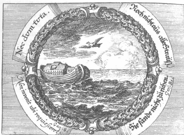
Fig. 2: Abgetrocknete Thränen. Nürnberg–Frankfurt, 1698. S. 72: „Dat escas multis mortalibus. Iob. 36.“, Kupferstich, 83 x 120 mm