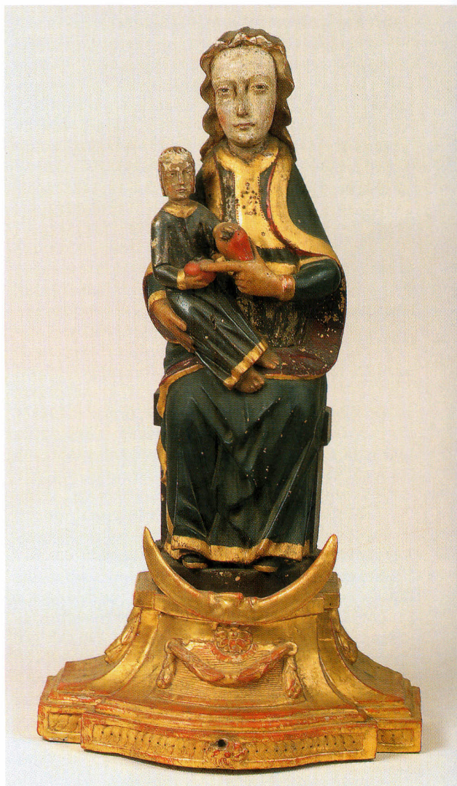
A celldömölki kegyszobor

1685-től kibontakozott zarándoklatok, melyeknek fontos szerepe volt a környék rekatolizációjában. Koptik a gimnázium után bölcséletet és jogot tanult a salzburgi egyetemen, majd 1713. január 2-án belépett a Sankt Lambrecht-i bencés apátságba. 1717. február 20-án szentelték pappá Grazban. Ezt követően különféle lelkipásztori feladatokat látott