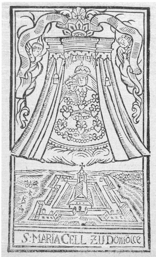
S. Maria Cell zu Dömölck. Hírlevél illusztrációja, 1745, fametszet. Synopsis Historica de situ, ortu, progressu S. Cellae Marianae in Hungaria [...] campo Dömölkiensi; in qua (ut decretum episcopale [...] die 17. Nov. 1745 Jaurini emanatum testatur) [...]. Pannonhalmi, Főapátsági Levéltár. Actorum Abbatiae Dömölkiensi, Fasc. 2. Nr. 1.

széli el. (vö. kat. IX–4.) A második kötetből említést érdemel Christoph Haizmann 1669-ben az ördöggel kötött szövetségének és csodálatos megsza- badulásának gazdagon illusztrált, nevezetes története. 10 A harmadik kötet az egyházi rend, a negyedik a világi uralkodók és előkelők, az ötödik az osztrák uralkodóház tagjainak Mariazellhez fűződő kapcsolatát mutatja be. 11 (vö. kat. IX–5, III–11.) A hatodik kötet a zarándokhelyen feljegyzett csodákat dolgozza fel, a kötet második részében a csoda-elbeszélésekben szereplő nemesi családok címerrajzai találhatóak. 12 Az utolsó kötet a jeles családok által felajánlott fogadalmi adományokat sorolja fel a családok nevének betűrendjében. A szöveget a családi címerek rajzai illusztrálják. 13