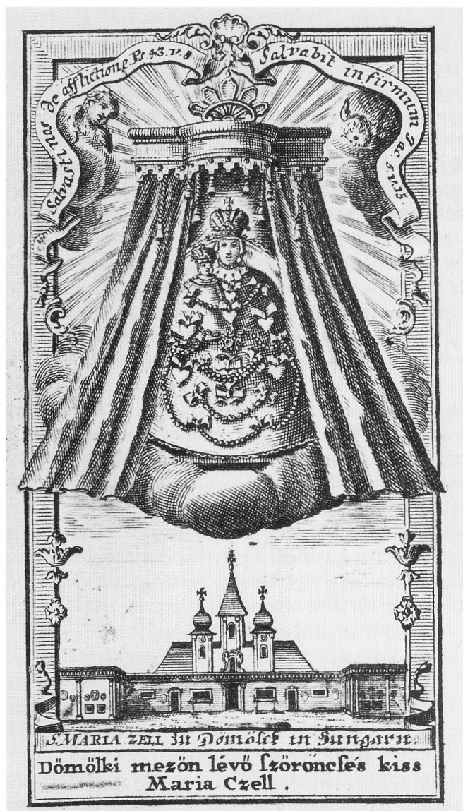
S. Maria Zell zu Dömölk in Hungarn. Dömölki mezőn lévő szöröncses kiss Maria Czell. Szentkép, 1740–1745 között, rézmetszet, Győr, Egyházmegyei Könyvtár

A kutatás már régebben rámutatott a zarándokhelyek legendaanyagának arra a sajátosságára, hogy a legendamotívumok a nagyobb helyekről áttevődnek a kisebbekre. 28 Ez az ún. legendafiláció jól megragadható a mariazelei és a jórészt ennek nyomán létrejött dömölki legendaanyagban. Dömölkön nem sokkal a kegyszobor kápolnában történt elhelyezése után többen a mariazelei szobornál észlelt csodás elváltozásokhoz hasonló látomásokról tesznek bizonyosságot. 29 Figyelemreméltó, hogy a másik nagy magyarországi Mariazell-filáció, Óbuda-Kiscell esetében nem tudunk ilyen