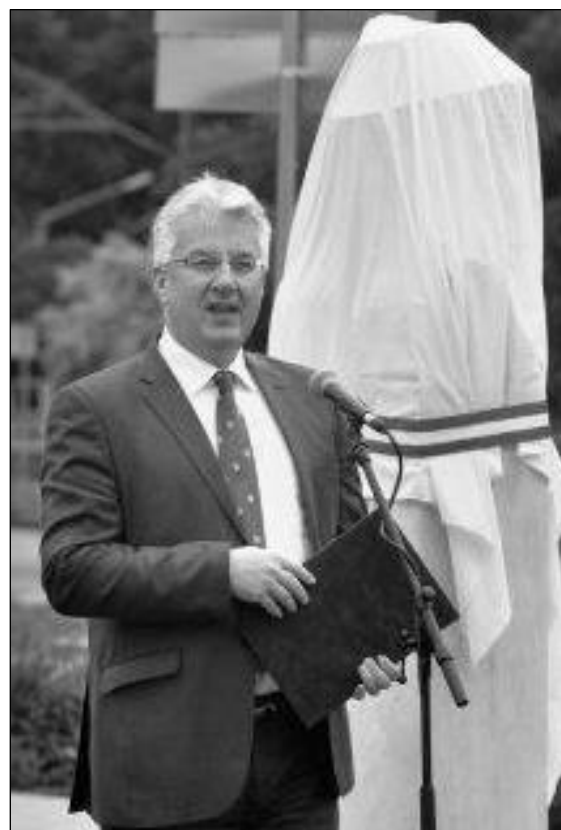
1. ábra: CHERNEL ISTVÁN agárdi szobra és az avatóbeszédet mondó SEMJÉN ZSOLT miniszterelnök-helyettes

Figure 1: ISTVÁN CHERNEL's sculpture in Agárd, and ZSOLT SEMJÉN, Deputy Prime Minister giving the inauguration speech