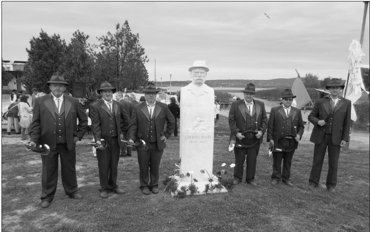
5. ábra: A CHERNEL szobor avatása Figure 5: The CHERNEL sculpture inauguration