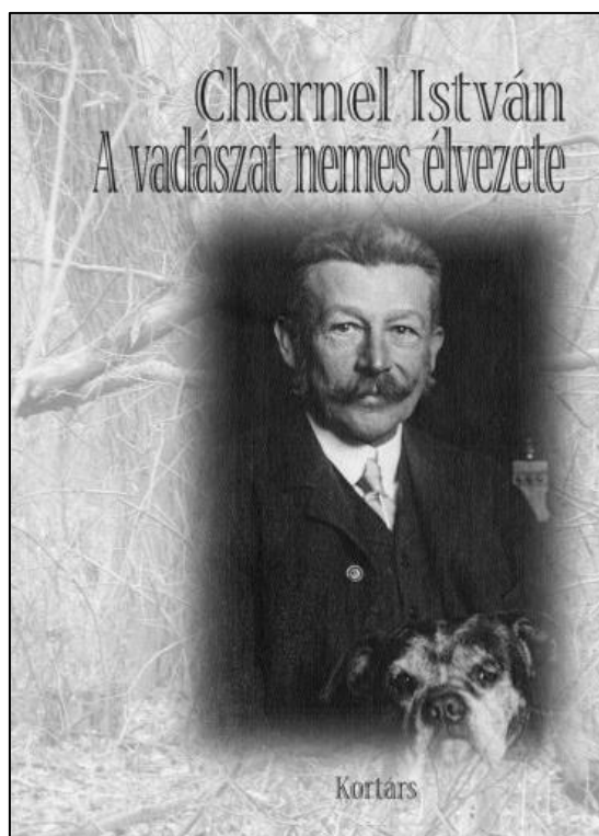
4. ábra: A CHERNEL szobor avatása alkalmával bemutatott könyv: CHERNEL I. (2015): A vadászat nemes élvezete (Szerk. MAJTHÉNYI L.). Kortárs Könyvkiadó, Budapest Figure 3: Second book presented during the CHERNEL sculpture inauguration