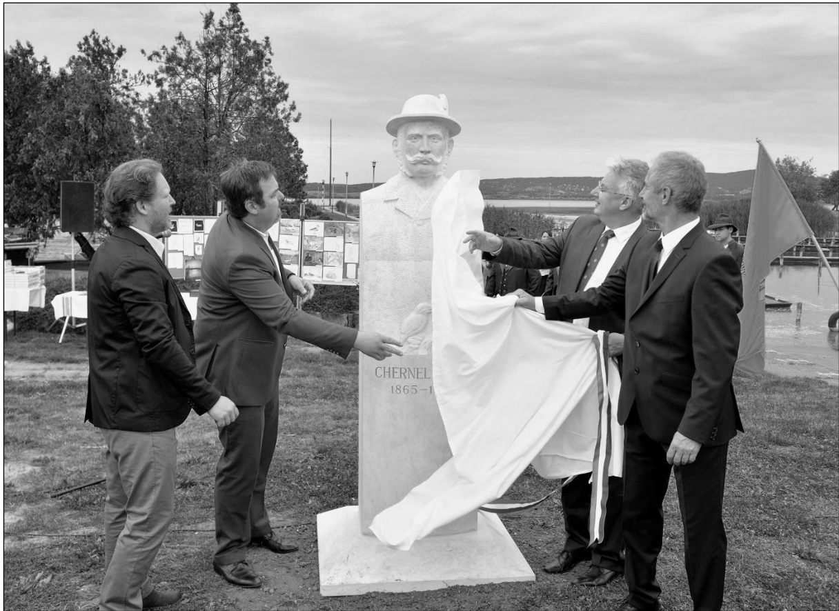
2. ábra: A CHERNEL szobor leleplezése (balról jobbra: KONTUR ANDRÁS szobrászművész, L. SIMON LÁSZLÓ államtitkár, SEMJÉN ZSOLT miniszterelnök-helyettes és TÓTH ISTVÁN polgármester)

Figure 2: Unveiling of the CHERNEL sculpture (ANDRÁS KONTUR sculptor, LÁSZLÓ L. SIMON undersecretary of state, ZSOLT SEMJÉN, Deputy Prime Minister and ISTVÁN TÓTH mayor)