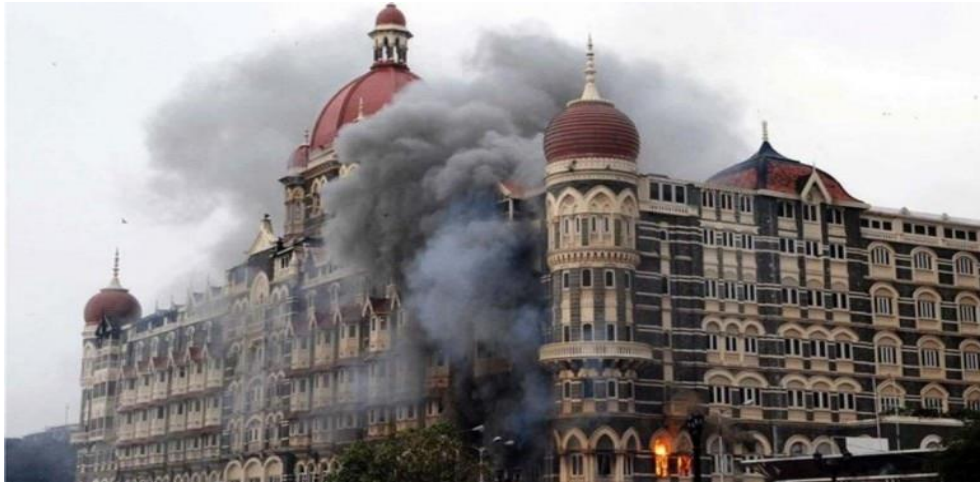
4. számú ábra: Taj Mahal Palace, Mumbai a terrortámadás idején. URL.: https://www.indiatoday.in/india/story/mumbai-attacks-eleven-years-since-26-11-nation-remembers-terror-victims-1622599-2019-11-26 (letöltve: 2020. 03. 07.)

támadók mozgását figyelemmel tudták követni, de a támadók létszám- és tűzerőfölénye miatt nem tudták felvenni velük a harcot. 412