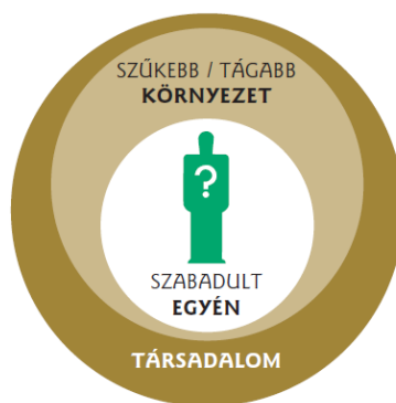
1. ábra: A szabaduló és a fogadó környezet.

büntetés-végrehajtási intézmény totálisan zárt jellegű, az oda való bekerülést követően az egyén szabad döntéseire alapuló hétköznapok helyett egy művi világot nyújt [3]. A fogvatartott elszigetelődik a külvilágtól, új rendszabályokat és követelményeket állítanak elé. Megismeri a zárt intézeti beilleszkedés sajátos érték- és normavilágát, a börtöntársadalom működését, és folytonos alkalmazkodásra kényszerül, melyet egy speciális tudás elsajátítása tesz számára lehetővé. A zárt közösség ingerszegény, "gondolatköre" és problémái specifikusak, szűk körben mozognak. A hétköznapok ugyanolyanok, szürkék és rendkívül unalmasak is, ám egyfajta biztonságot is nyújtanak. A döntésmegvonás fájdalmas, de egyben felelősségmentes is. Megfosztják az autonómiától, de kiszolgálják, a döntéseket helyette és nélküle hozzák, ami számos esetben rendkívül kényelmes, és nincs felelősség. Legfontosabb "tevékenység" az idő múlásának várása, azaz a szabadulás pillanatának eljövetele [4]. A szabadulás azonban – várva várt, örömteli, ugyanakkor gyakran fájdalmas, bizonytalan, nyugtalanító és félelmetes – összességében hasonlatos a krízishez, vagy akár maga a krízis. A szabadult helyzete és problémái egyre szűkülő-táguló koncentrikus körökként is felfoghatók, azaz a szabadultat, mint egyént körülveszi szűkebb-tágabb környezete (család, emberi kapcsolatai lakóhelyének közössége, ill. a társadalmi intézmények köre), amit a társadalom ölel körül (1. ábra).