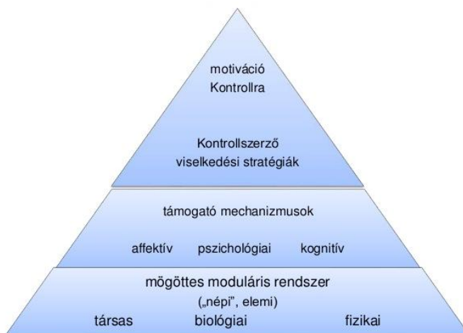
2. ábra. Geary - biológiailag elsődleges és másodlagos struktúrák.

másodlagos ismeretek elsajátítása erőfeszítést, saját akaratot igényel, amely különbséget nem szabad elfelejteni vagy figyelmen kívül hagyni az oktatásban. A kisgyerekek úgy bővítik a szókincsüket, hogy nem tesznek erőfeszítéseket érte, míg az iskolásokat, minél magasabb osztályfokon tanulnak, annál inkább, biztatni kell, jutalmat-büntetést kell kilátásba helyezni, stb. ahhoz, hogy megtanulja egy szó jelentését matematikából, fizikából vagy idegen nyelvből. Ennek enyhítésére a másodlagos ismereteket elsődleges ismeretek segítségével kell(ene) tanítani, azaz például valós problémákkal elindítani az ismeretszerzést, vagy az olvasás gyakorlása során a szociális kapcsolatokat feldolgozó rendszereiket megcélózni az olvasmányban leírt történetekkel, eseményekkel, kapcsolati problémákkal (Geary, 1995, 2004, 2007 – lásd: 2. ábra).