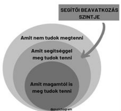
1. ábra. Vygotszkij proximális (legközelebbi) fejlődési zóna („Zone of Proximal Development” – ZPD) elmélete. (Forrás: Boross, 2014; a szerző kiegészítésével)

nálni, amiket addigi életében elsajátított. Ezzel a körsávval érintkezik kívülről a „közeli zóna” (ZPD), amiben olyan dolgok vannak, amiket még nem tud, de már érti, amit segítséggel meg tud csinálni. Az elmélet szerint a tanítás akkor hatékony, ha a tanuló aktuális fejlettségi szintjét megelőzi, de nem annyira, hogy az a tanuló számára már érthetetlen. Az elgondolást legjobban elképzelni talán egy körkörös ábra alapján lehet. Az egyén a körkörös helyzet, ismeretekkel teli „tér” közepén helyezkedik el, egy olyan sávban, ahol olyan „tudások” vannak, amelyek mind-egyikét tudja, ismeri, meg tudja csinálni, amiket addigi életében elsajátított. Ezzel a körsávval érintkezik kívülről a „közeli zóna” (ZPD), amiben olyan dolgok vannak, amiket még nem tud, de már érti, amit se-