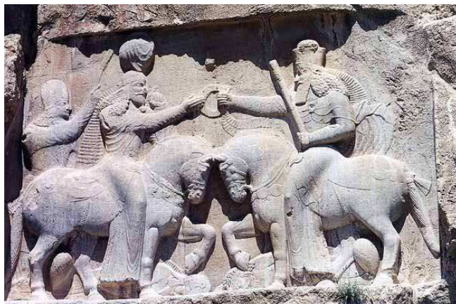
2. ábra: Ormuzd megbízza Ahrimánt, képforrás: http://www.absoluteastronomy.com/topics/Ahura_Mazda