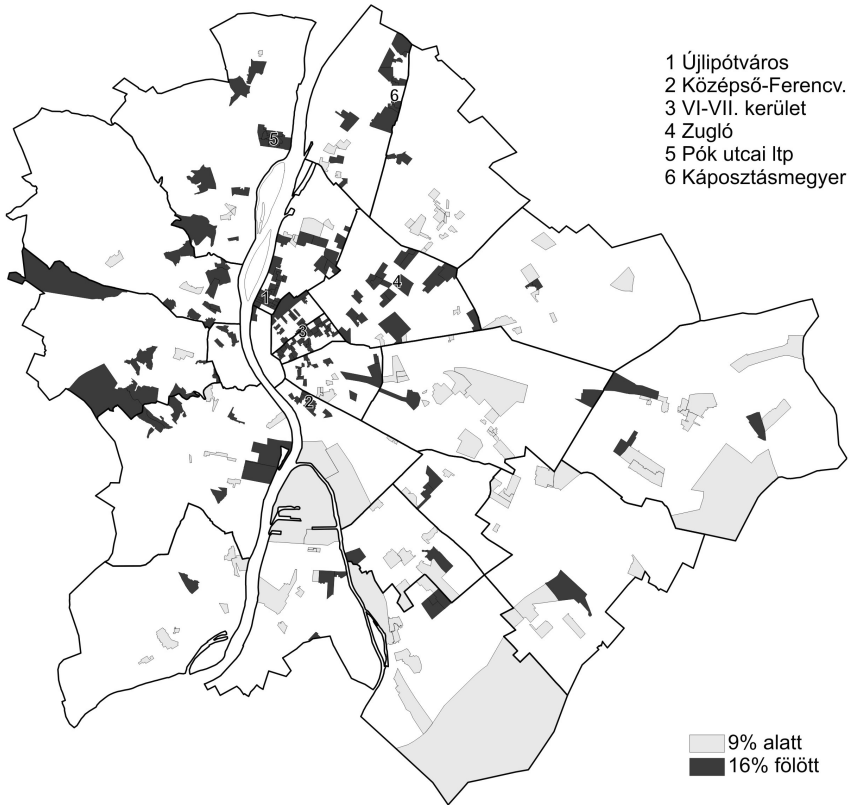
2. térkép. Az LMP legjobb és legrosszabb fővárosi eredményei (%)

A főváros belső negyedei közül egyedül a Középső-Ferencváros átalakulása tekinthető egy közel 20 éve tartó folyamatnak. Itt egy viszonylag szűk területen igen erőteljes volt a lakók társadalmi összetételének változása. A választói magatartás ezzel párhuzamosan már 2002-ben is a környezetétől eltérő, a magas státuszú területekéhez hasonló liberális és centrista pártpreferenciákkal rendelkező negyed képét mutatta (Szabó, 2010). 2010-re még élesebbé váltak a különbségek: az LMP kiugró (18% feletti) és átlag alatti szavazóköréi éppen ott találkoznak, ahol az építkezések véget érnek (ehhez némileg hasonlít Angyalföld gyors ütemben megújuló középső része – jóllehet ez nem is belvárosi terület). A nagyütemben újjáépülő Középső-Józsefváros esetében még nem vizsgálható ez a fajta kicserélődés, hiszen az épületek nagy része még csak épül, illetve üresen, vagy félig üresen áll. Másfajta átalakulás megy végbe a VI. és VII. a kerületben. Ott pontszerűen épülnek az új házak, valamint a régi épületek felújítása is igen előrehaladott, de ezek elszórtan helyezkednek el. Itt