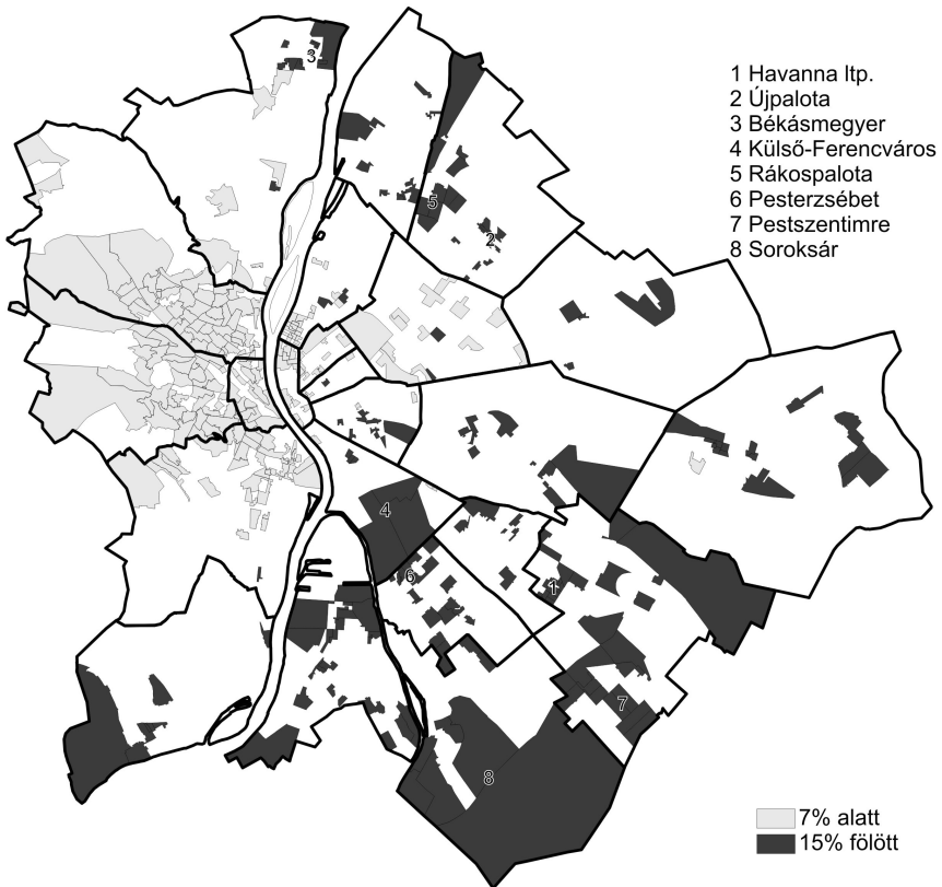
3. térkép. A Jobbik legjobb és legrosszabb fővárosi eredményei (%)

Első ránézésre a területi megoszlásból az tűnik föl, hogy a Jobbikra leadott szavazatok a külső kerületekben koncentráálódtak, jelentős részben az 1970-es