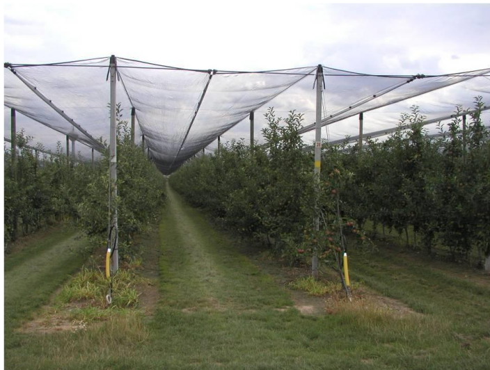
1. ábra. Korszerű, intenzív, jégvédőhálós almaültetvény

A jégvédő háló rendszer kialakításának típusa lehet lapos vagy oromzatos. Legnagyobb elterjedése az oromzatos kivitelezésnek van. A háló, polietilén anyagból készül, mely UV-stabilizátor adalékanyaggal van ellátva. Kettős, illetve hármass fonatú változatokban találkozhatunk vele. A fonatok egy téglalapot alakítanak ki, melynek mérete általánosságban 2,9 x 7,0 mm. A kisebbik oldal az ültetvény sorra merőlegesen, míg a hosszabb oldala az ültetvény sorral párhuzamosan fut. Szakítószilárdsága függ a háló fajtájától, általában ez az érték 2900 kg/m 2 . Legnagyobb élettartama (15-20 év) és szakítószilárdsága a fekete hálónak van, ugyanakkor ez a típus a legkisebb fényáteresztő képességgel rendelkezik. A fehér hálók várható élettartama 5-10 év és ezeknek van a legnagyobb fényáteresztő tulajdonságuk [1]. A kettő közötti átmenetre szolgálnak a piros, zöld, valamint a különböző kombinációk (például: piros-zöld, fekete-fehér, stb.), melyek különböző mértékben engedik át a napfényt [2]. A hálók során alkalmazott plakettek ajánlatos maximális távolsága 1,5 m. Ennek oka pedig a hasadékok elkerülése az illesztések mentén, valamint az egyenletes teherelosztás [5][9].