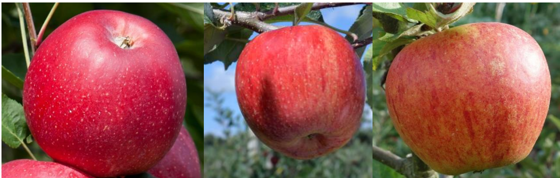
2. ábra. A kísérletben szereplő almafajták (balról jobbra: 'Anaglo'; 'Brookfield' és 'Schniga')

A vizsgálatokat a Neumann János Egyetem, Kertészeti és Vidékfejlesztési Karán végeztük el három 'Gala' mutáns ('Anaglo', 'Brookfield', és 'Schniga') (2. ábra). Ezen 'Gala' mutánsok érési ideje augusztus utolsó dekádja, így a szüretre augusztus végén (2019.08.26.) került sor, melyet vizsgálatok követtek. Annak érdekében, hogy pontos és valós adatokat mérhessünk a három vizsgált fajtának szüretelésére egyszerre került sor.