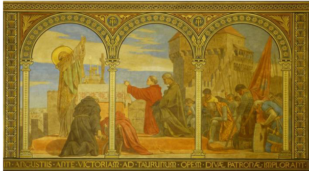
2. kép – Székely Bertalan: Kapisztrán Szent János miséje. a) tempera festmény. b) freskó, pécsi székesegyház, Mária-kápolna

A Trónoló Madonna Szent Imrével és Szent Margittal jelenet tempera vázlatán ugyan csak kisebb eltérések figyelhetők meg az elkészült seccóhoz képest. A vázlaton a Madonna mögött kétoldalt különbözőképpen ábrázolta Székely az angyalok karát: balra nagyméretű kerubok, jobbra dekoratív, kárpitra szőtt szeráfsor jelenik meg. További eltérés mutatkozik a trónus előtt gomolygó felhőkön, illetve a jobb szélén térdelő angyal füstölőt tartó mozdulatában. Az angyal kéztartásának megváltoztatásával még szimmetrikusabbá vált a kompozíció.