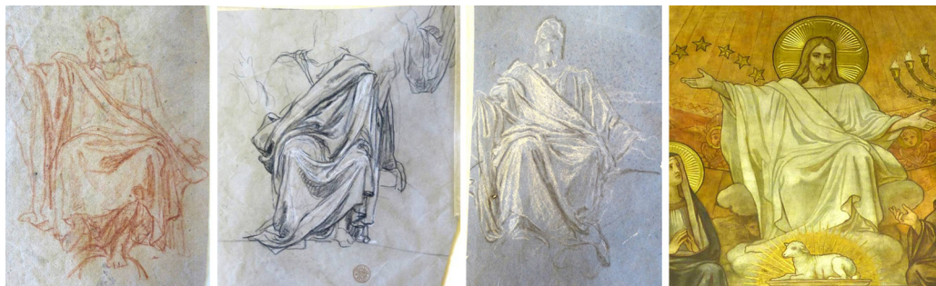
3. kép – Lotz Károly: Trónoló Krisztus. a–c) három vázlat, Magyar Nemzeti Galéria, Grafikai Osztály, Pécsi székesegyház című mappá. d) freskó, pécsi székesegyház, Corpus Christi-kápolna, Apokalipszis

Egy-egy alakhoz akár több kéztartást is kipróbált, ez figyelhető meg a Jézus szíve-kápolna Keresztrefeszítés-freskójának Mária Magdolna alakján, vagy Corpus Christi-kápolna Apokalipszisének trónoló Krisztus figuráján. A trónoló Krisztus alakhoz öt vázlatot készített Lotz, különböző kartartásokkal kísérletezve (3. kép). Három kartartást próbált ki a