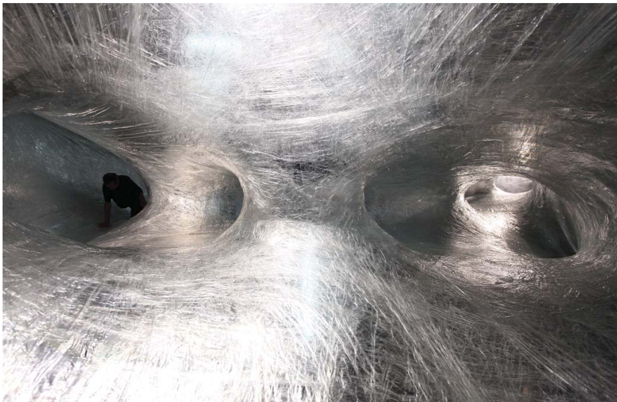
Ragasztószalagokból készült járatrendszer a párizsi Tokió Palotában