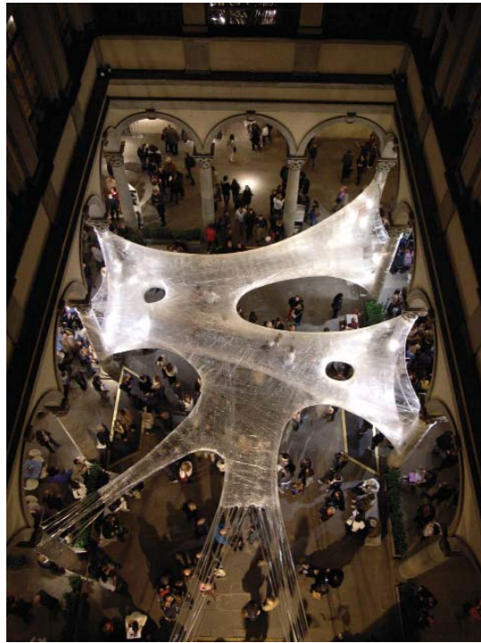
Térfoglalás a firenzei Strozzi-palota átriumában

Az „aut. architektur und tirol” innsbrucki építészeti központ elasztikus hálóból szőtt térinstallációja távol áll