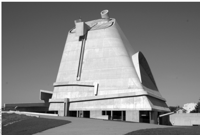
fény: Richard Weil

szépség forrása van jelen, akinek kizárólagos joga önmagát tetszésének megfelelően kinyilvánítani. 4 Ebből következik, hogy a liturgiát Isten mindent felülmúló szépsége hatja át, amelyben övéit részesíti az egyház közössége által. A helyesen végzett istentisztelet azért szép, mert a szépség veritatis splendor, avagy az „igazság ragyogása”. 5 „Éppen ezért a szépség nem dekoratív eleme a liturgikus cselekménynek; hanem inkább alkotó eleme, mint magának Istennek és az Ő kinyilatkoztatásának sajátossága.” 6